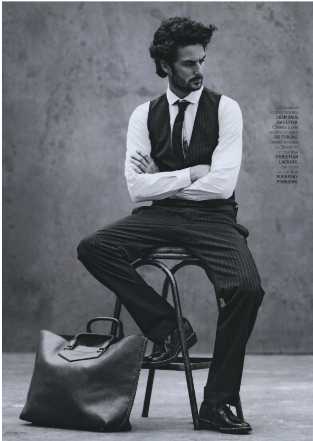
Combinaison en drap de coton JEAN PAUL GAULTIER. Chemise à petit col rond en coton DE FURSAC. Cravate en coton et Chaussures en cuir lisse CHRISTIAN LACROIX. Sac cabas en cuir lisse BURBERRY PRORSUM.