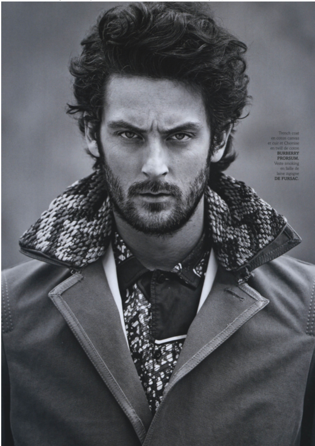
Trench coat en coton canvas et cuir et Chemise en twill de coton BURBERRY PRORSUM. Veste smoking en faille de laine zigogne DE FURSAC.