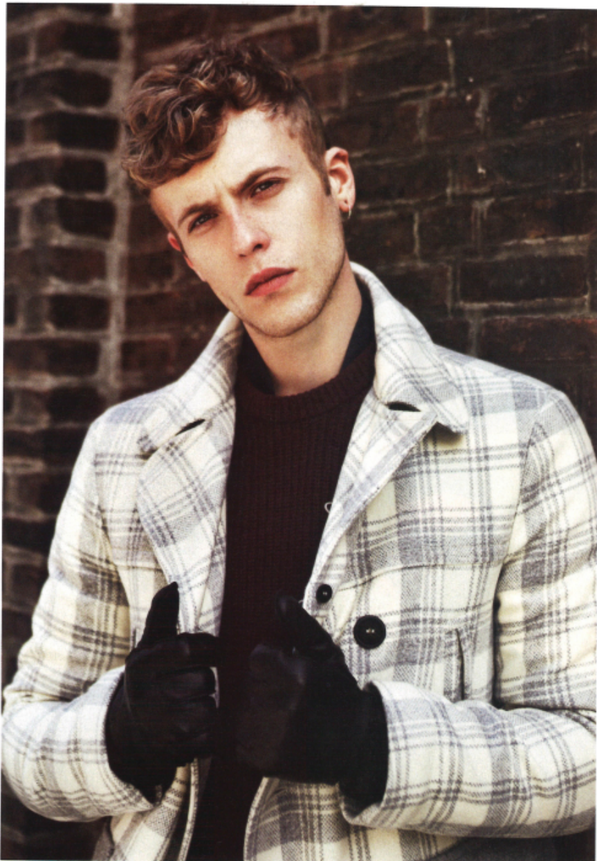
Tra gli edifici da visitare c'è anche la Casa Museo di Rubens, che il grande pittore acquistò nel 1610 e che abitò fino al 1640, anno della sua morte. Giaccone, maglie e guanti Peutezey, foulard Bigi Cravatte.