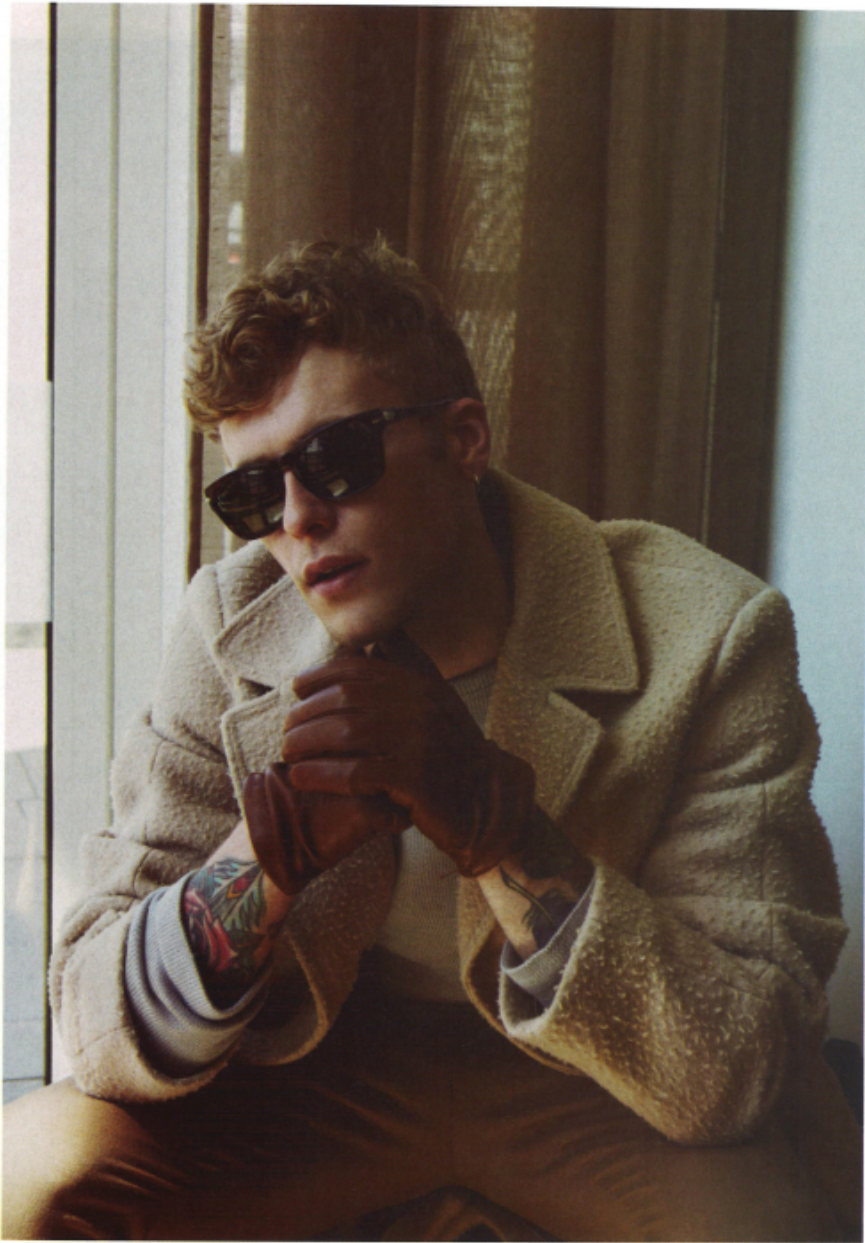
Ad Anversa si trova un importante Museo della moda, che ospita una collezione di oltre 25 mila pezzi. Cappotto, maglia e pantaloni Gucci , occhiali Pasol e guanti De Rosa .