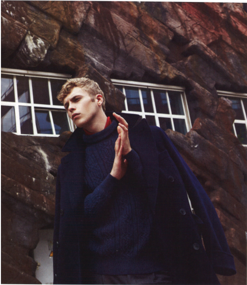
Sullo sfondo, il muro dello Zoo di Anversa, situato nel centro della città. Nel riquadro, cappotto, maglia e pantaloni Lezo Piana .