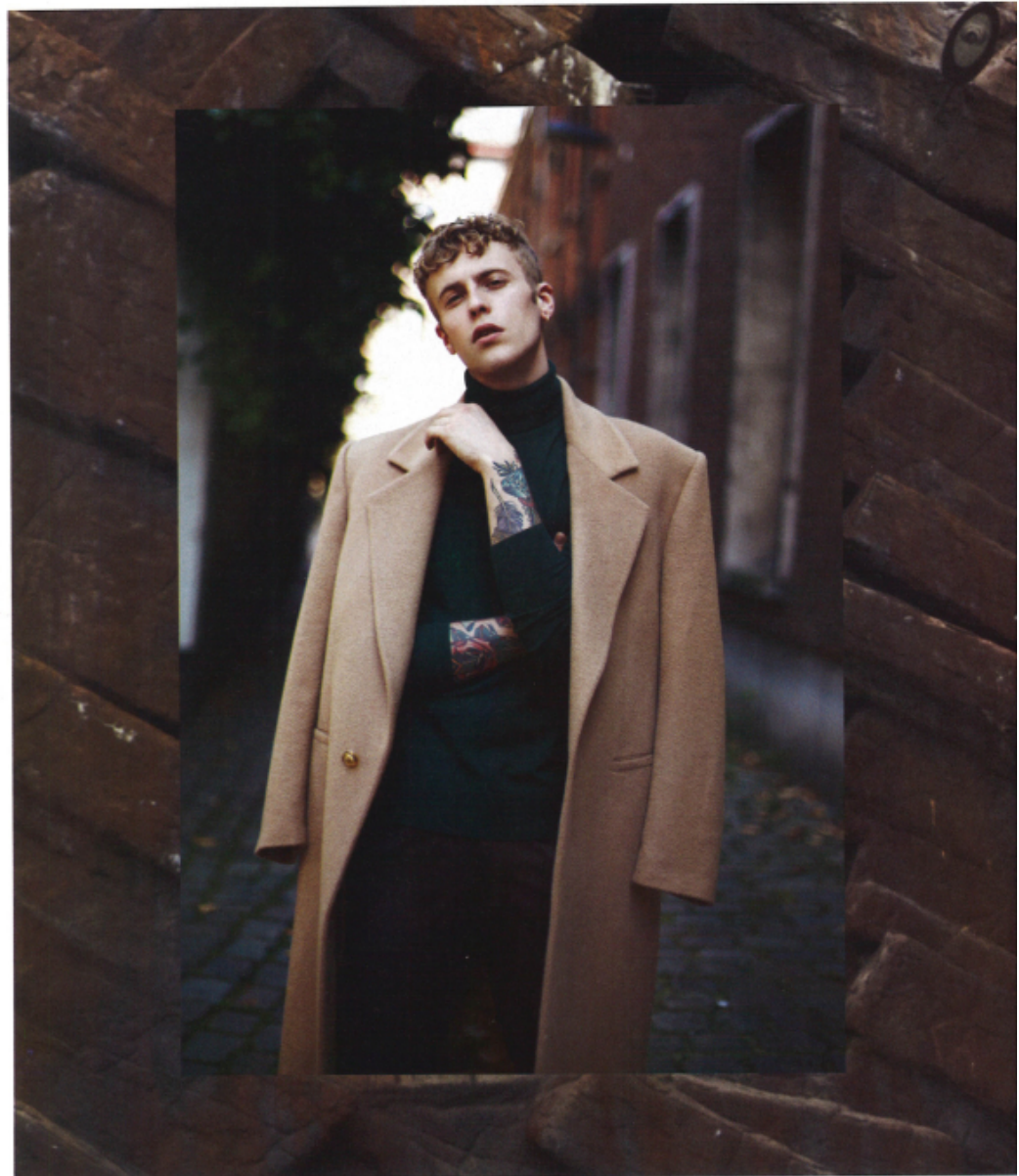
Nel riquadro, una via del centro storico della città. Cappotto, maglia e pantaloni Versace .