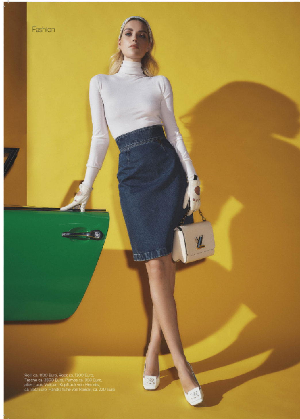
Rolli ca. 1100 Euro, Rock ca. 1300 Euro, Tasche ca. 3800 Euro, Pumps ca. 950 Euro, alles Louis Vuitton, Kopftuch von Hermès, ca. 360 Euro. Handschuhe von Roeckl, ca. 220 Euro