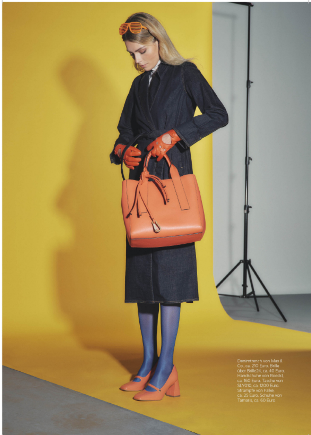
Denimtrench von Max & Co., ca. 210 Euro. Brille über Brille24, ca. 40 Euro. Handschuhe von Roeckl, ca. 160 Euro. Tasche von SLY010, ca. 1200 Euro. Strümpfe von Falke, ca. 25 Euro. Schuhe von Tamaris, ca. 60 Euro