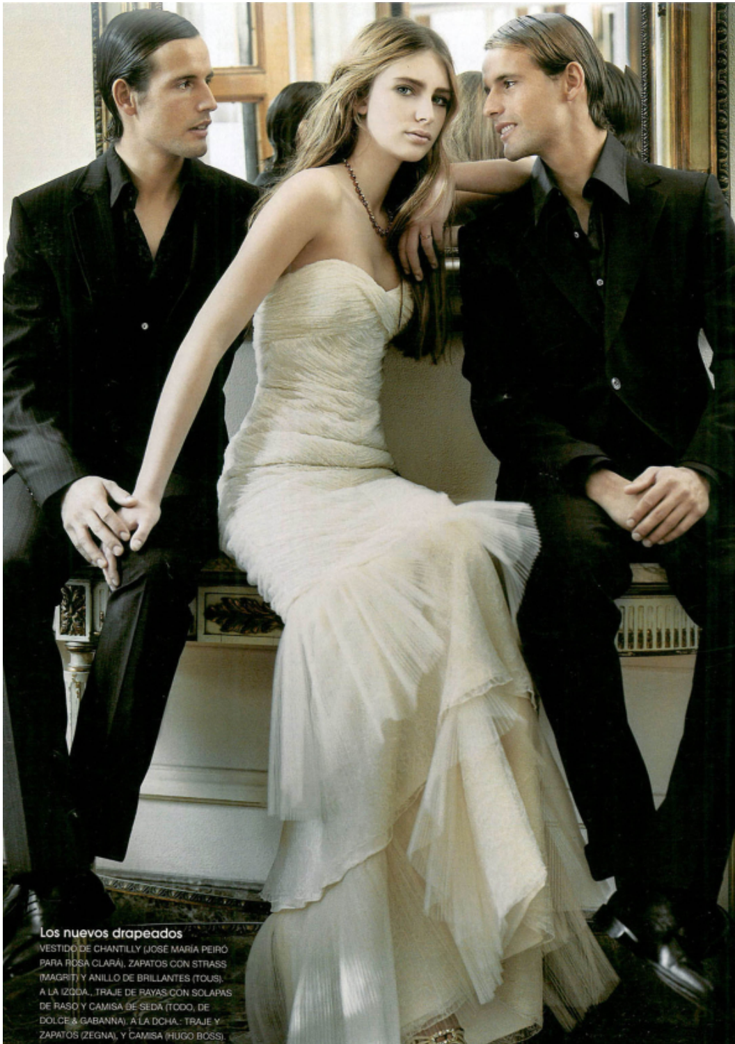
Los nuevos drapeados VESTIDO DE CHANTILLY (JOSÉ MARÍA PEIRO PARA ROSA CLARÁ), ZAPATOS CON STRASS (MAGRIT) Y ANILLO DE BRILLANTES (TOUS). A LA IZQDA., TRAJE DE RAYAS CON SOLAPAS DE RASO Y CAMISA DE SEDA (TODO, DE DOLCE & GABBANA); A LA DCHA.: TRAJE Y ZAPATOS (ZEGNA), Y CAMISA (HUGO BOSS).