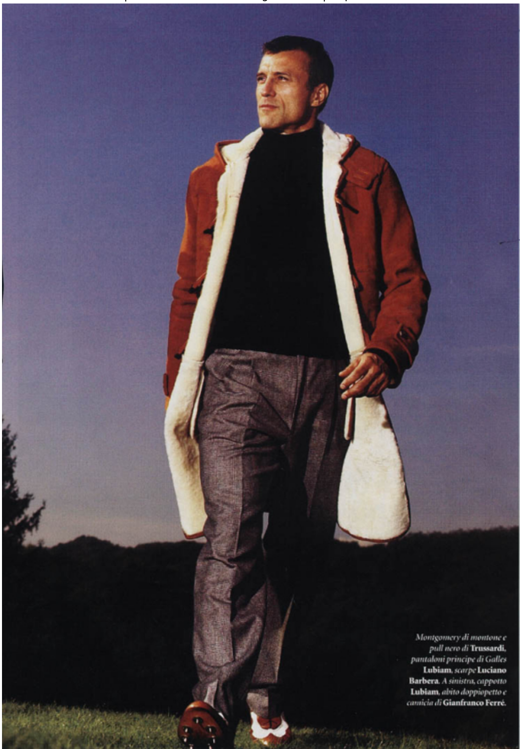
Montgomery di montone e pull nero di Trussardi, pantaloni principe di Galles Lubiam, scarpe Luciano Barbera. A sinistra, cappotto Lubiam, abito doppiopetto e camicia di Gianfranco Ferré.