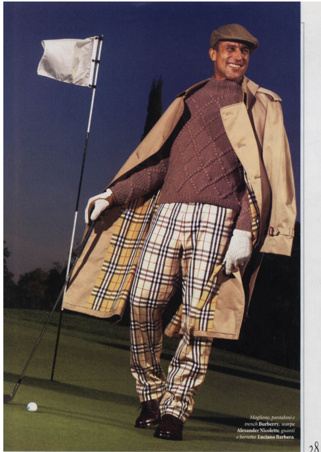
Maglione, pantaloni e trench Burberry, scarpe Alexander Nicolette, guanti e berretto Luciano Barbera.