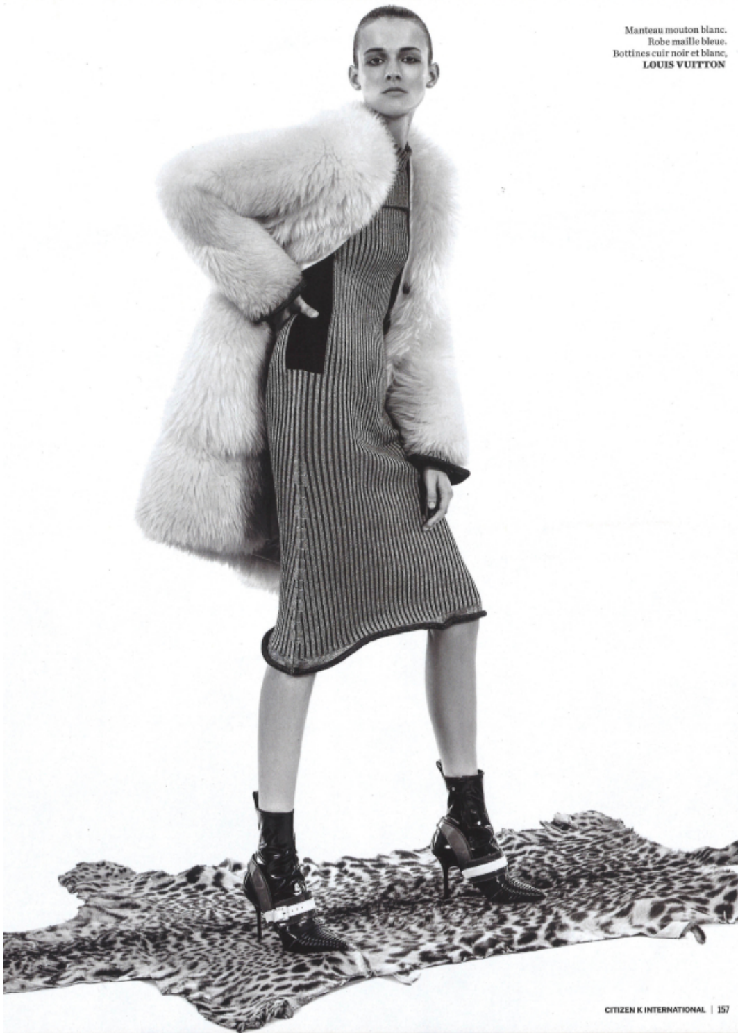
Manteau mouton blanc. Robe maille bleue. Bottines cuir noir et blanc, LOUIS VUITTON