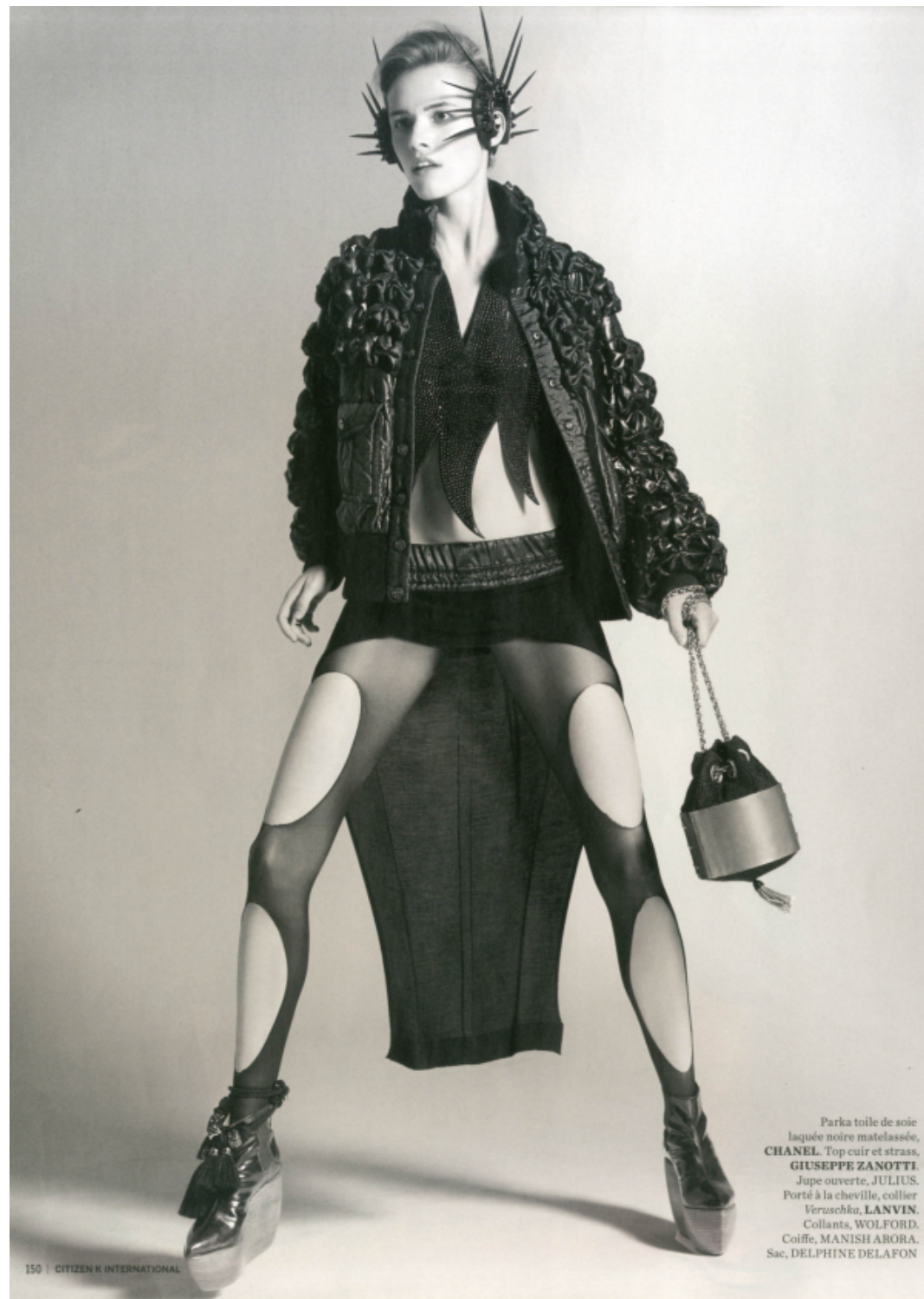
Parka toile de soie laquée noire matelassée, CHANEL . Top cuir et strass, GIUSEPPE ZANOTTI . Jupe ouverte, JULIUS . Porté à la cheville, collier Veruschka, LANVIN . Collants, WOLFORD . Coiffe, MANISH ABOBA . Sac, DELPHINE DELAFON