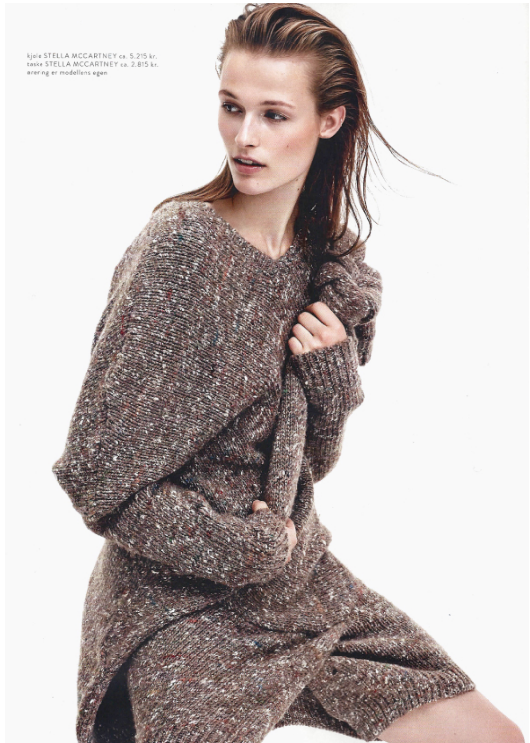
kjole STELLA MCCARTNEY ca. 5.215 kr. taske STELLA MCCARTNEY ca. 2.815 kr. erering er modellens egen