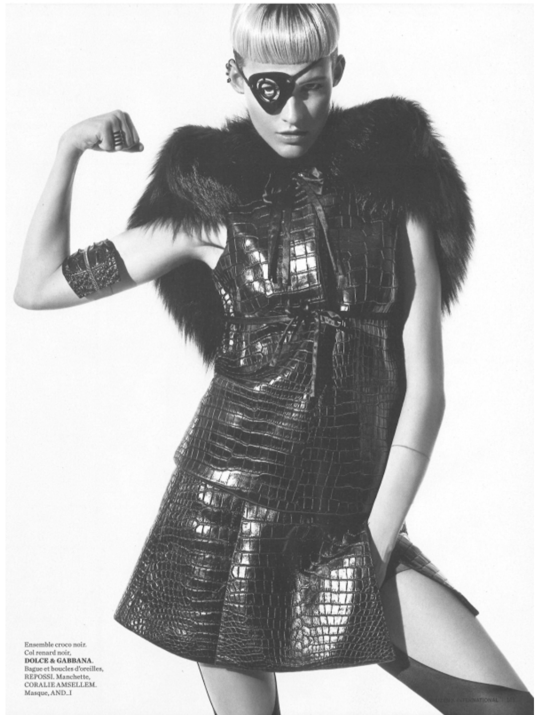
Ensemble croco noir. Col renard noir, DOLCE & GABBANA. Bague et boucles d'oreilles, REPOSSI. Manchette, CORALIE AMSELLEM. Masque, AND_I