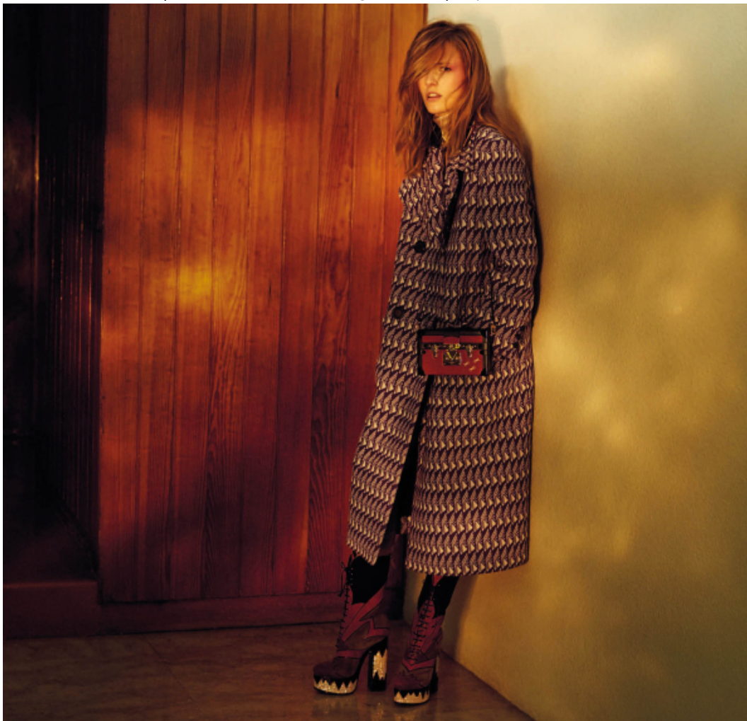
Cappotto di lana nappé con colletto di pelle, Miu Miu. Clutch di pelle zigrinata con tracolla, Louis Vuitton. Pagina accanto. Giacca di cotone stampato, Bottega Veneta. Camicia da smoking di cotone e gemelli d'argento, Paul Smith. Anelli d'ottone con cristalli, Gucci.