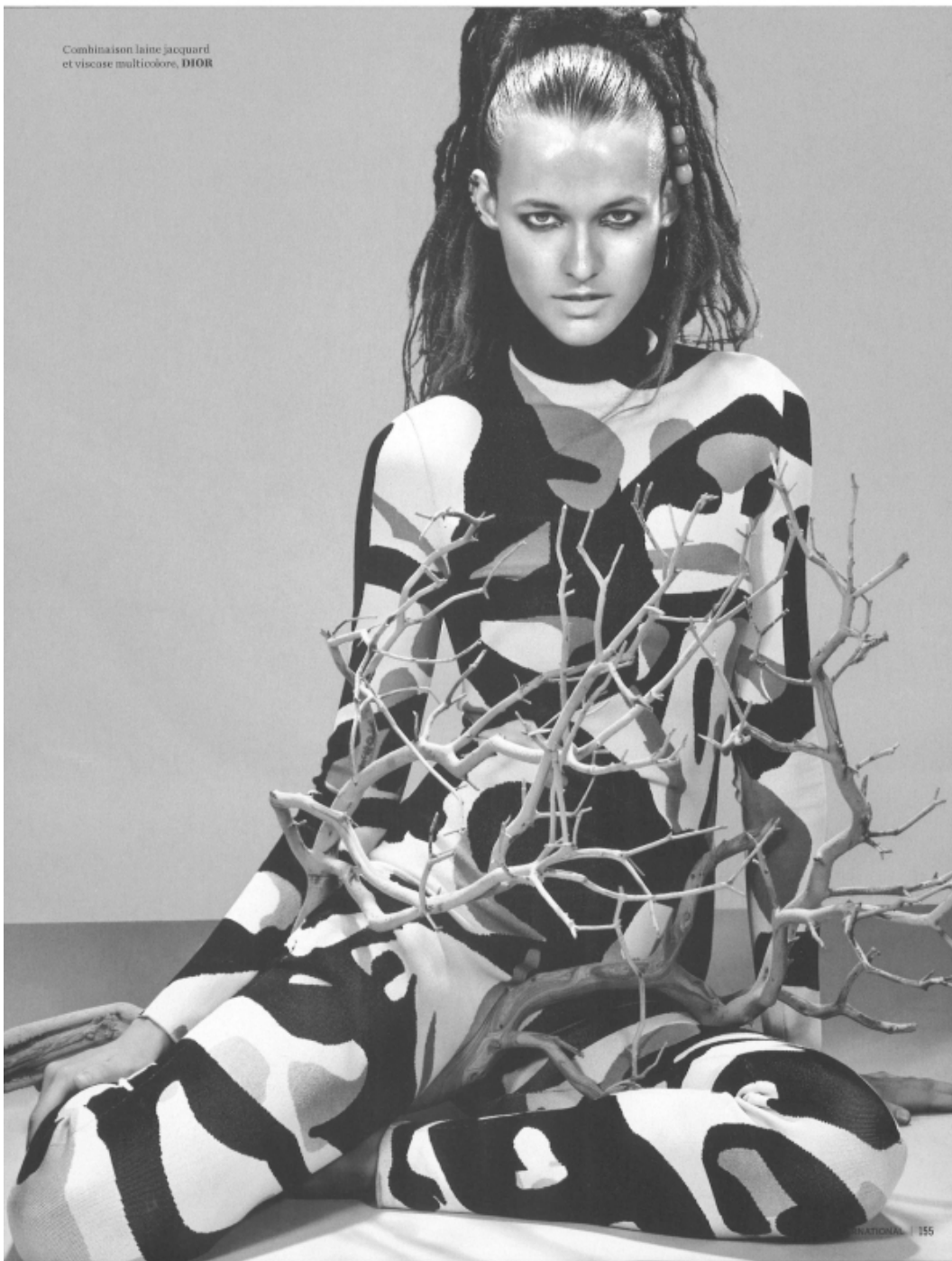
Combinaison laine jacquard et viscose multicolore, DIOR