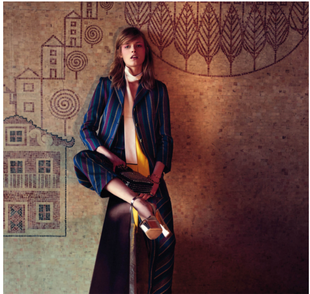
Tailleur di cotone con monopetto e gilet, Tommy Hilfiger Collection. Sclarpa, Andrea Pompilio. Minibag con borchie, Blumarine. Sandali gold, Giuseppe Zanotti Design. Pagina accanto. Spencer di viscosa e pantaloni di lino, Ralph Lauren Collection. Camicia in seta, Roberto Cavalli. Cravatta, Paul Smith. Minibag di rettille, Saint Laurent by Hedi Slimane.