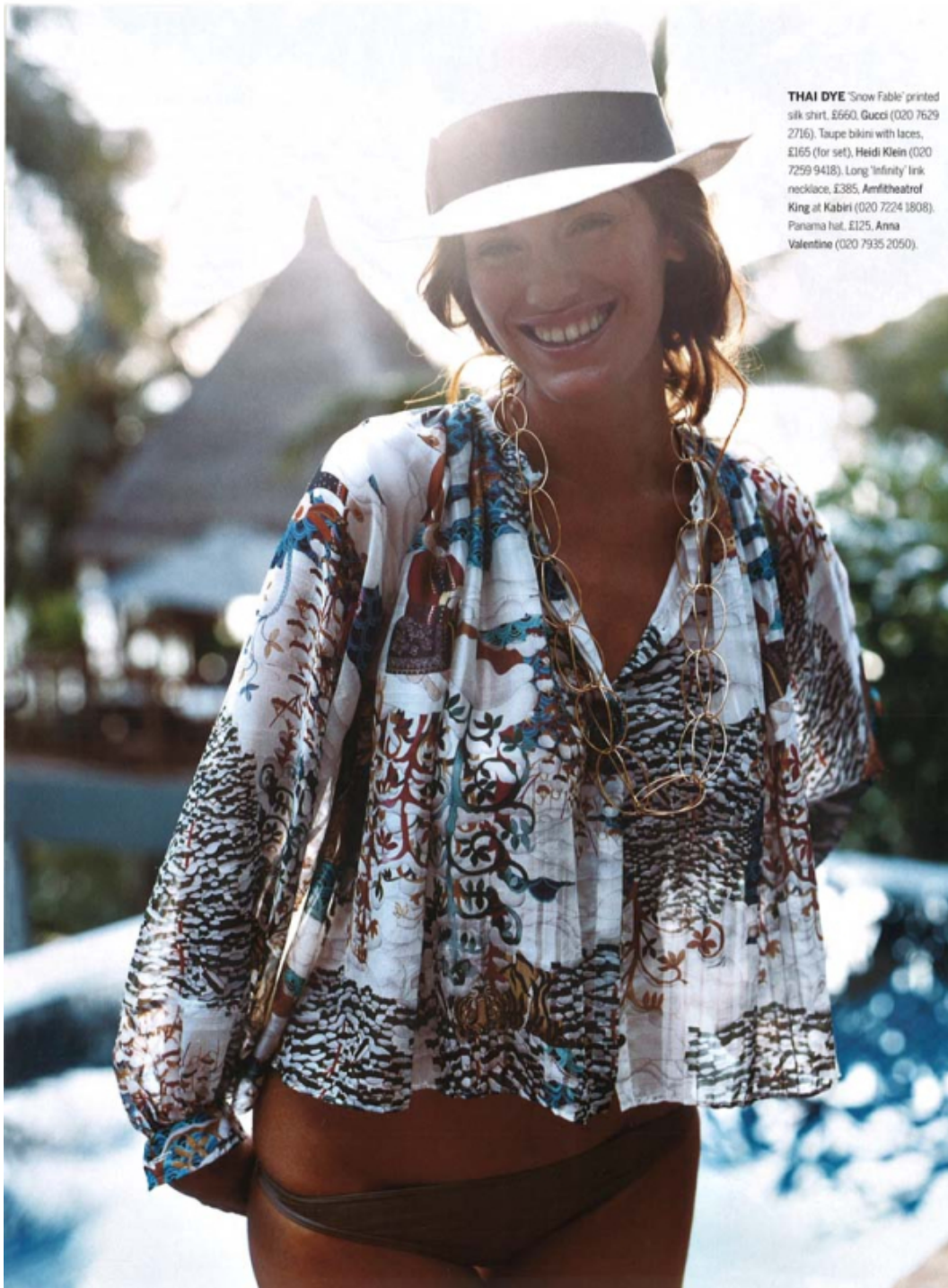
THAI DYE 'Snow Fable' printed silk shirt, £660, Gucci (020 7629 2716), Taupe bikini with laces, £165 (for set), Heidi Klein (020 7259 9418), Long 'Infinity' link necklace, £385, Amfitheatrof King at Kabiri (020 7224 1808), Panama hat, £125, Anna Valentine (020 7935 2050),