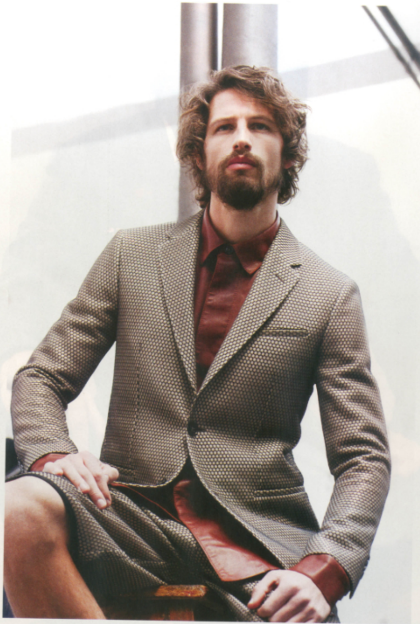
Giacca e pantaloncini DIRK BIKKEMBERGS Camicia TRUSSARDI