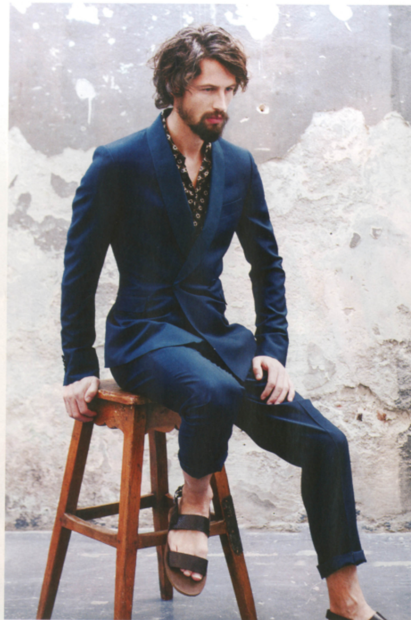
Completo Z ZEGNA Camicia JUST CAVALLI Sandali CAR SHOE