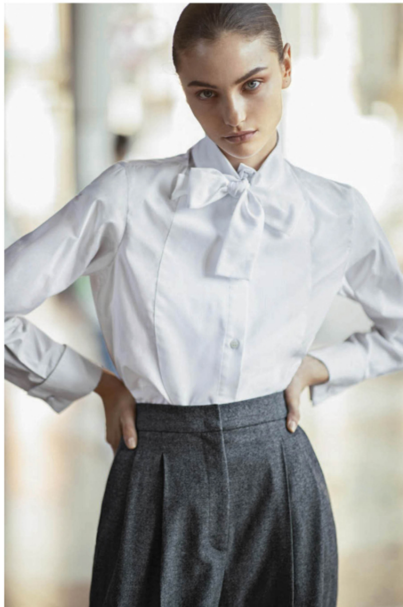
Blusa in popeline di cotone con fiocco, EMPORIO ARMANI . Pantaloni con pince, SEVENTY VENEZIA . Pagina accanto : impermeabile in cotone e nylon tecnico, MAX & CO . Stivali, BOTTEGA VENETA .