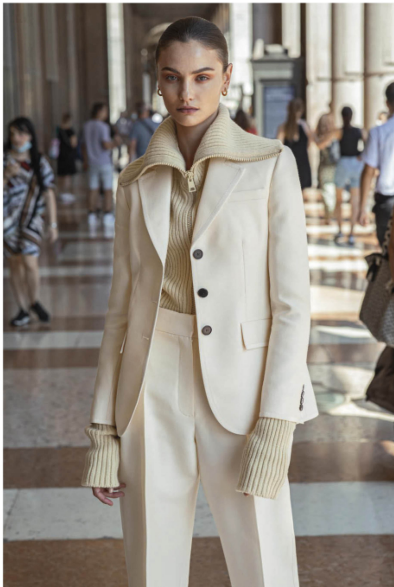
Tailleur in seta tussah, DIOR . Pull e orecchini, BOTTEGA VENETA . Pagina accanto: giacca, dolcevita, pantaloni e cintura, ALBERTA FERRETTI . Bracciale, UNOAERRE FASHION JEWELLERY . Stivali, BOTTEGA VENETA .