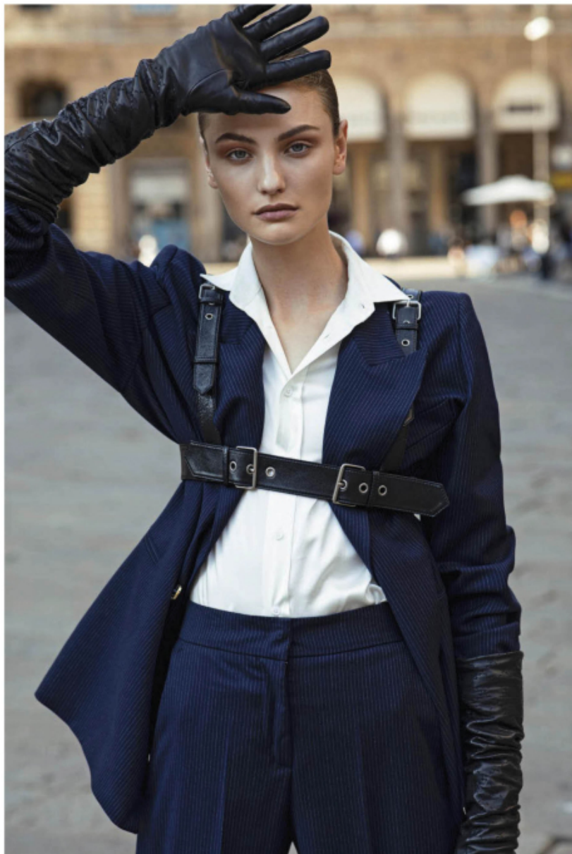
Doppiopetto e pantaloni slim in lana gessata, COMPAGNIA ITALIANA . Camicia da smoking, RALPH LAUREN COLLECTION . Corsetto di pelle, GUCCI . Guanti, vintage. Pagina accanto : completo in velluto con pantaloni a vita alta e coulisse in pelle, HERMÈS . Cappello, LUISA SPAGNOLI . Stivaletti, BOTTEGA VENETA .