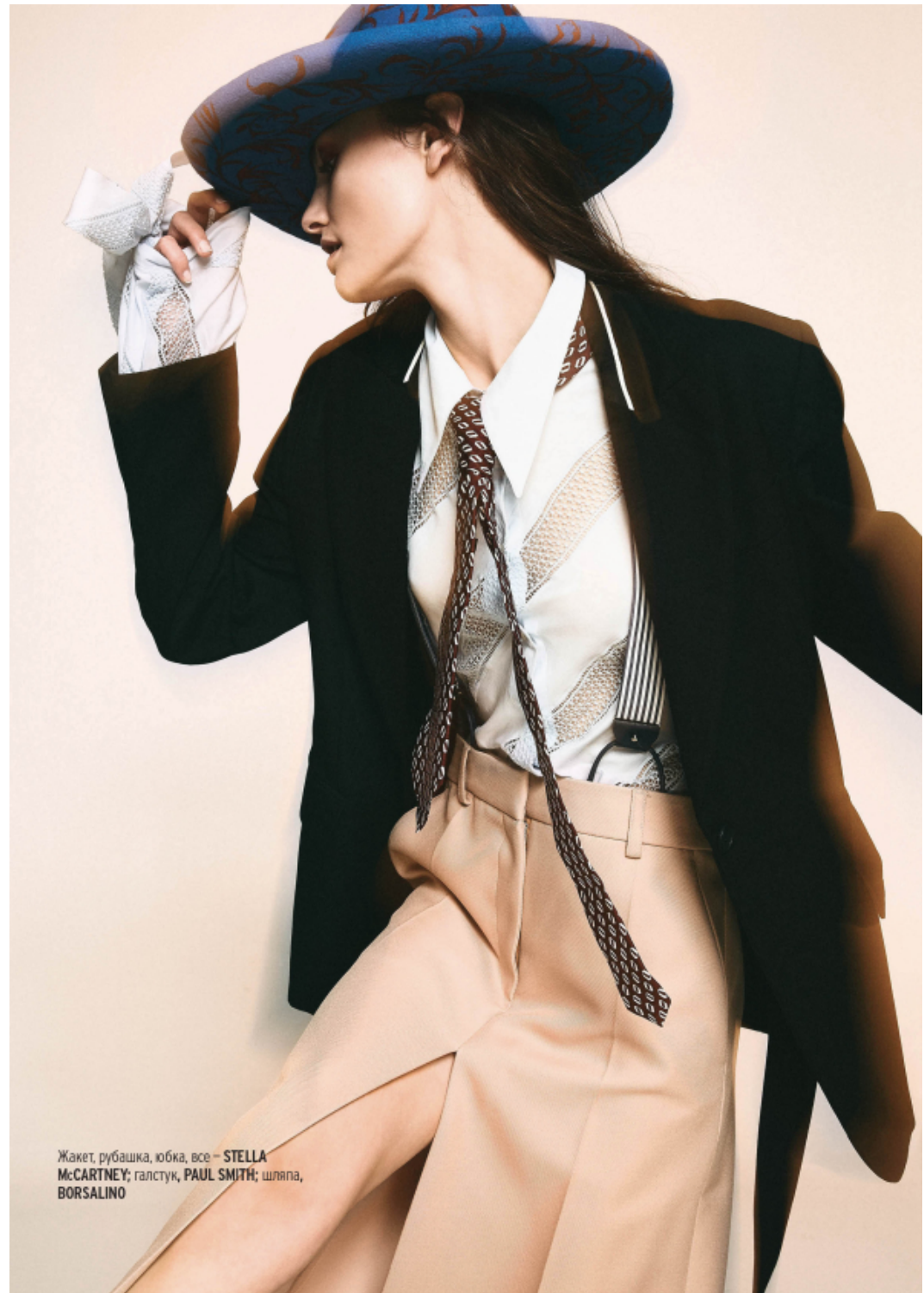
Жакет, рубашка, юбка, все – STELLA Mc CARTNEY; галстук, PAUL SMITH; шляпа, BORSALINO