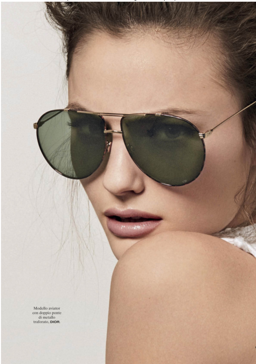
Modello aviator con doppio ponte di metallo traforato, DIOR .