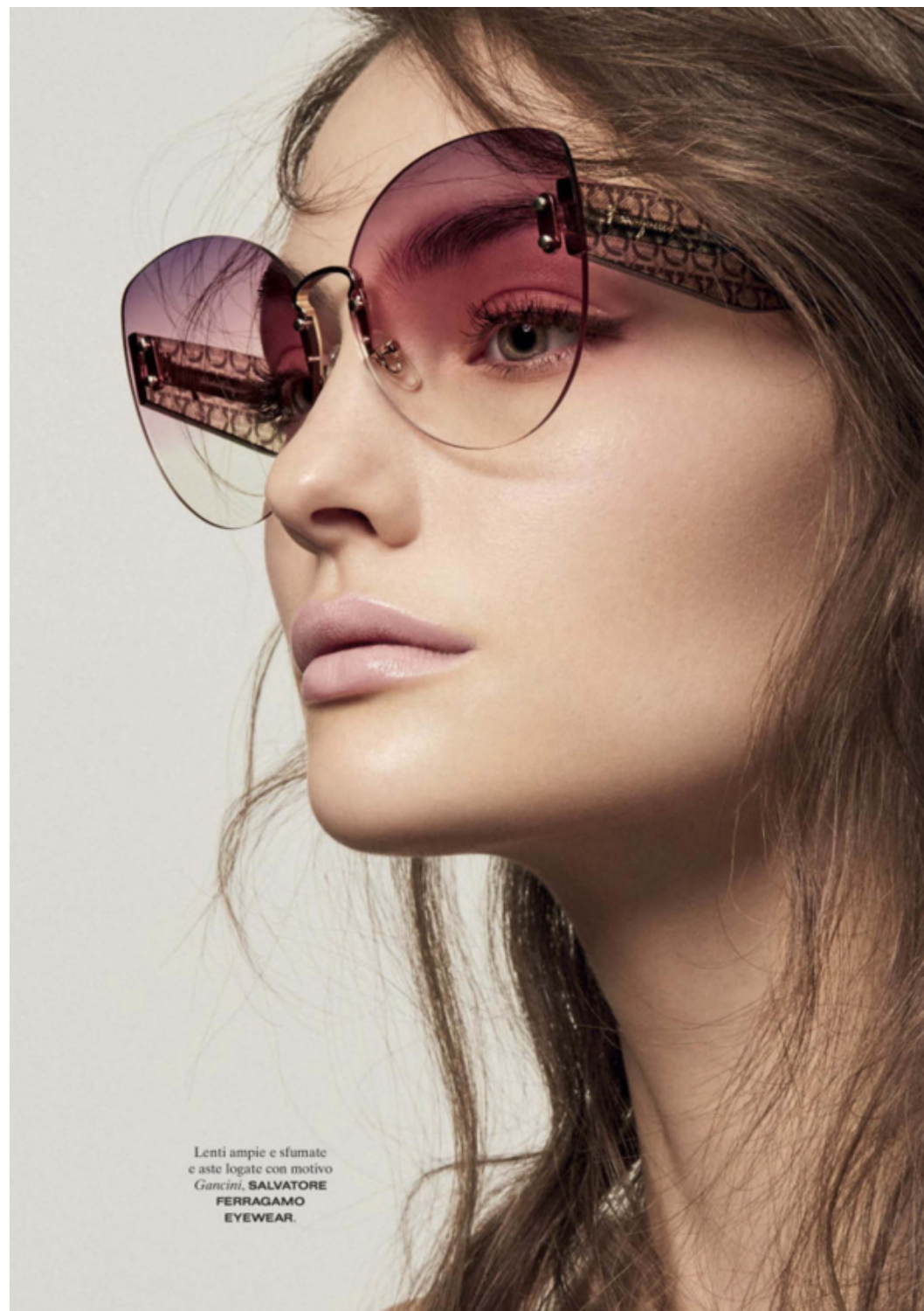
Lenti ampie e sfumate e aste logate con motivo Gancini , SALVATORE FERRAGAMO EYEWEAR .