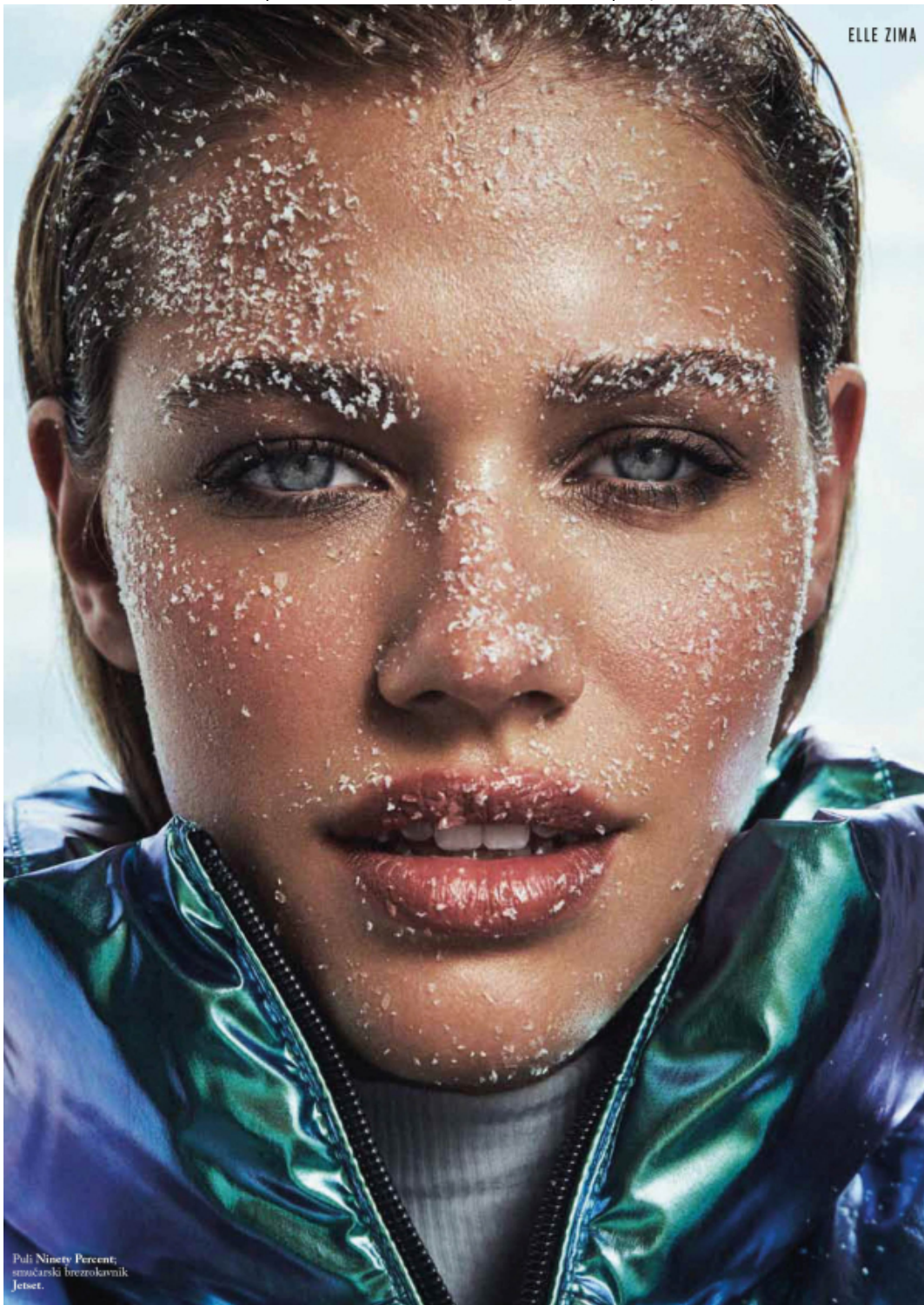
Puli Ninety Percent, snačarski brezokavnik Jetset.