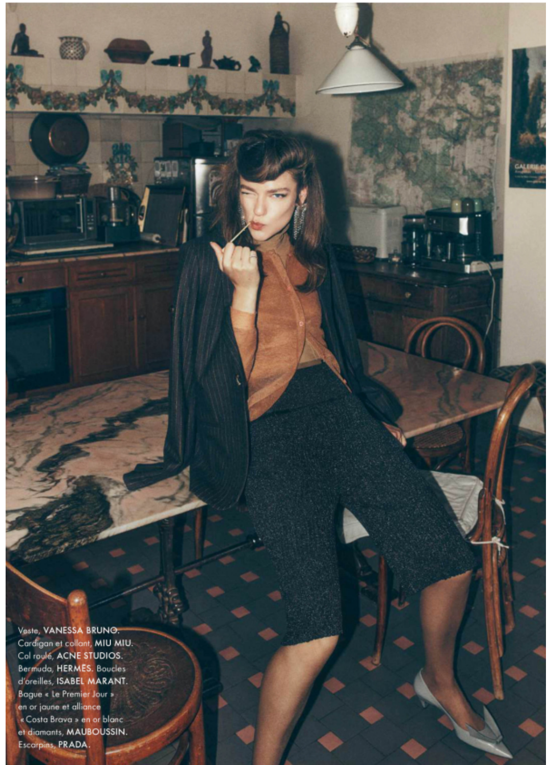
Veste, VANESSA BRUNO. Cardigan et collant, MIU MIU. Col roulé, ACNE STUDIOS. Bermuda, HERMÈS. Boucles d'oreilles, ISABEL MARANT. Bague « Le Premier Jour » en or jaune et alliance « Costa Brava » en or blanc et diamants, MAUBOUSSIN. Escarpins, PRADA.