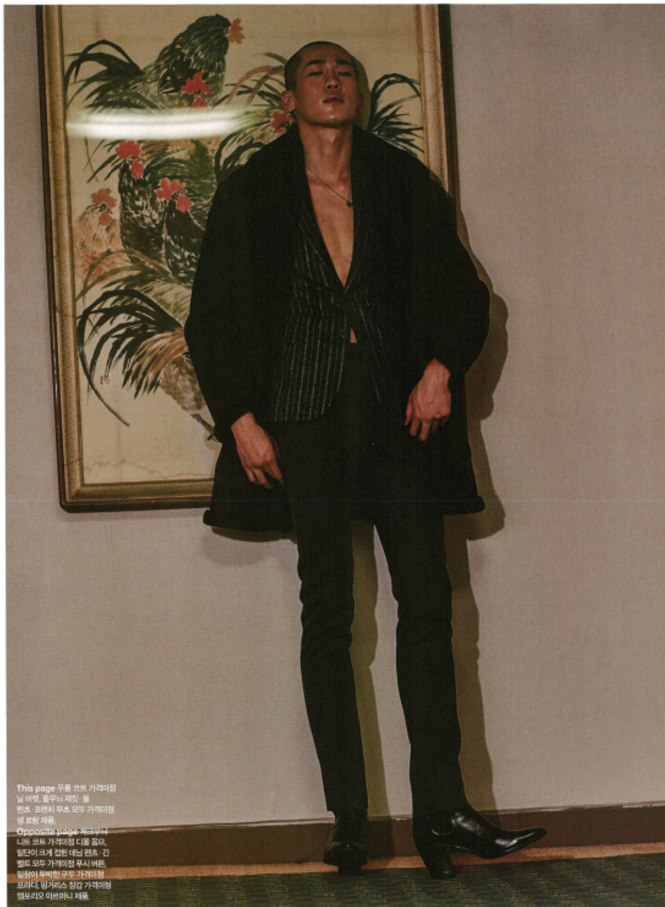
This page 무릎 전체 가격미정 날 바넷, 울루니 재킷, 폴 린츠, 프렌치 무츠 모두 가격미정 생 로랑 재킷 Opposite page 복고풍 나뭇잎 코트 가격미정 디올 울트, 알타이 크게 접힌 데님, 켈츠, 긴 벨트 모두 가격미정 후시버튼, 밀랑이 투박한 구두 가격미정 프리디, 벨거리스 장갑 가격미정 펠트리오 이베리니 재킷