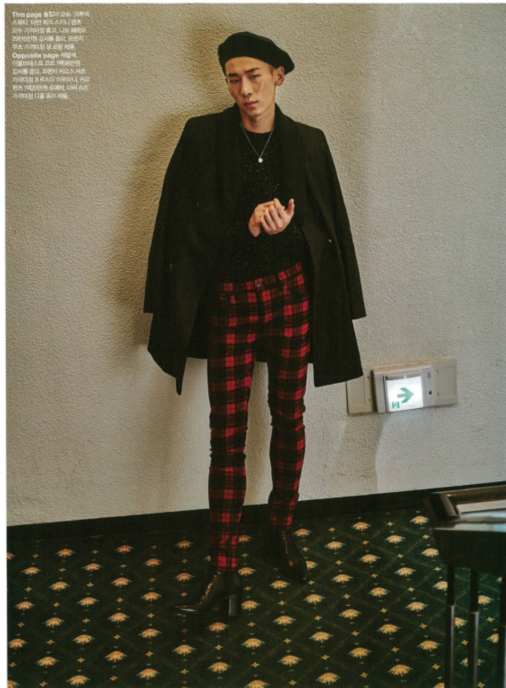
This page 울타리 코트, 크루세 스웨터, 티안 제르 스카프, (연초 모두 가격미정 울트, 나뭇잎 코트 20018재킷, 긴셔플, 폴트, 프렌치 무츠 가격미정 생 로랑 재킷 Opposite page 재킷, 생 로랑, 벨트, 프렌치 카모스 셔츠 가격미정, 벨트, 긴셔플, 벨트, 긴 벨트, 벨트, 벨트, 벨트, 벨트, 벨트 가격미정 디올 울트 재킷