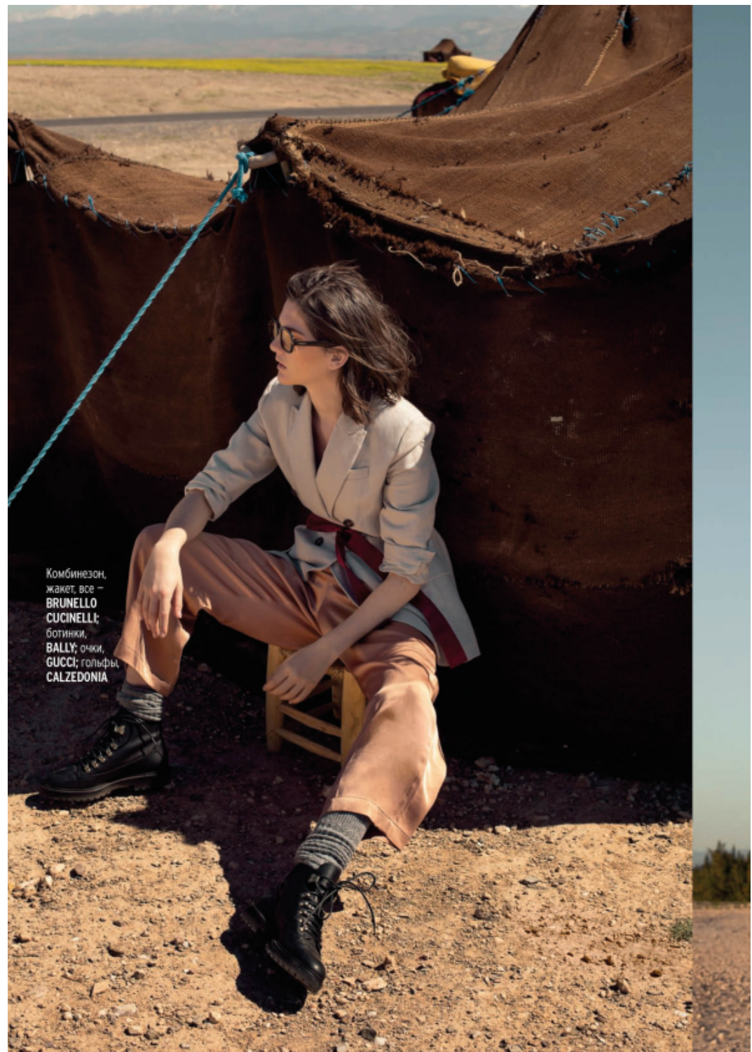
Комбинезон, жакет, все — BRUNELLO CUCINELLI; ботинки, BALLY; очки, GUCCI; гольфы, CALZEDONIA