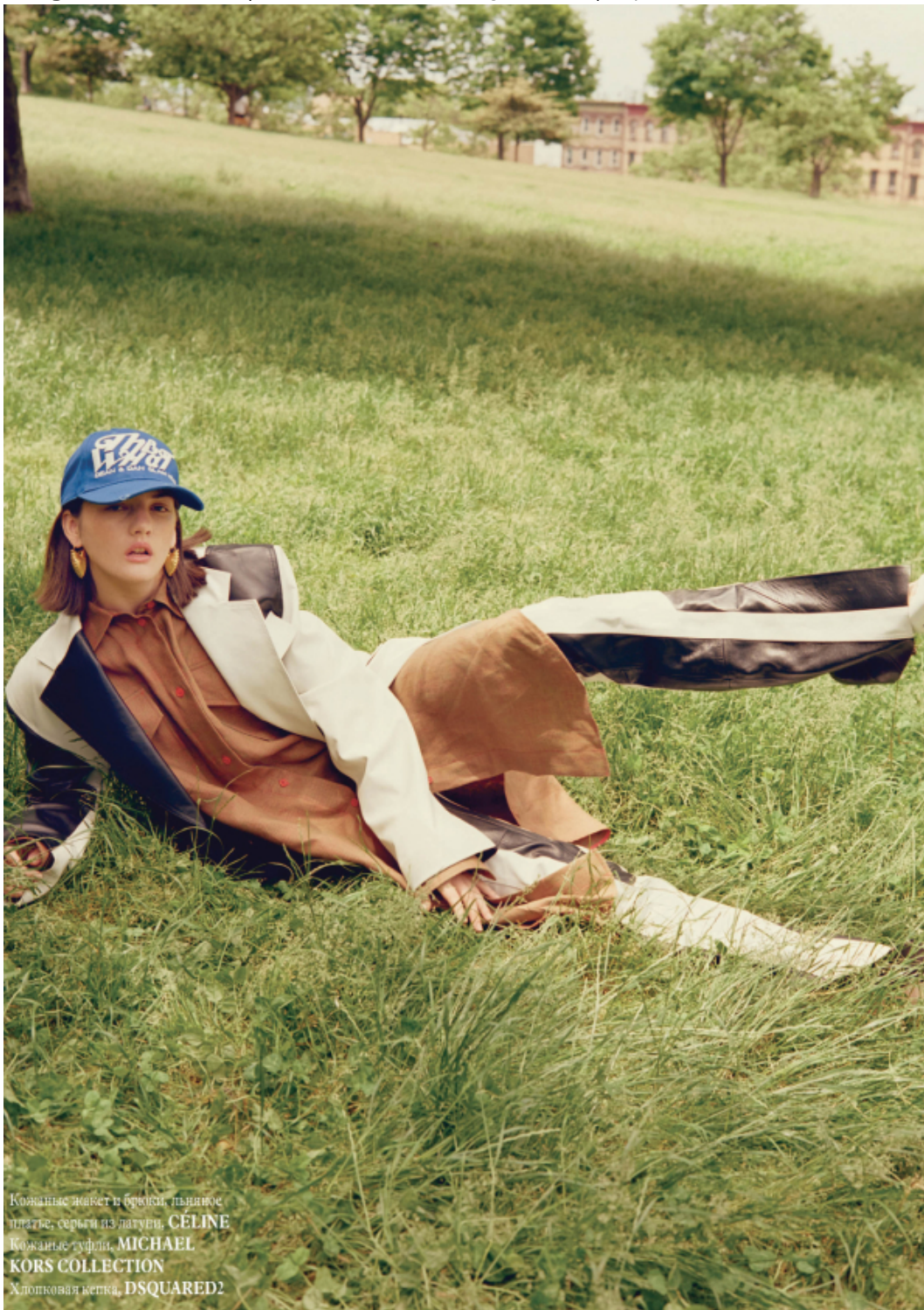
Кожаные жакет и брюки, пыльное платье, серьги из лагуны, CÉLINE Кожаные туфли, MICHAEL KORS COLLECTION Хлопковая кепка, DSQUARED2