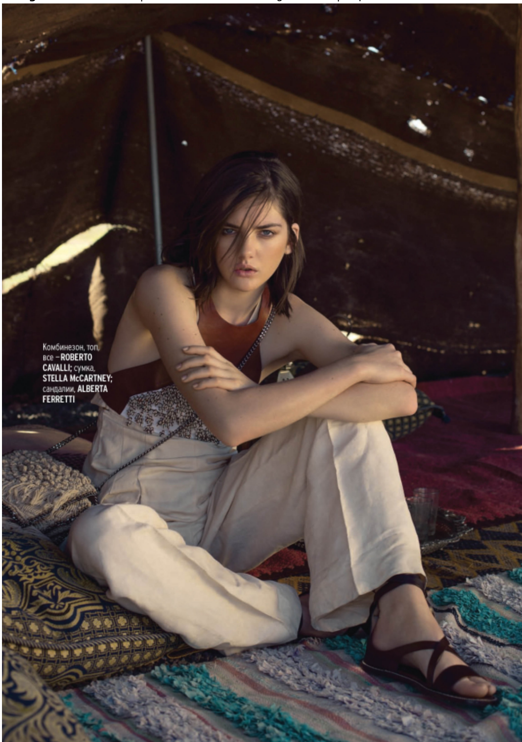
Комбинезон, топ, все – ROBERTO CAVALLI ; сумка, STELLA McCARTNEY ; сандалии, ALBERTA FERRETTI