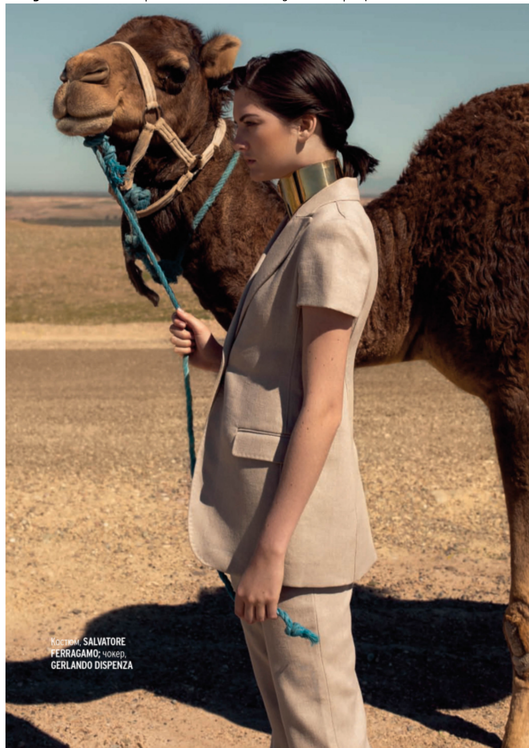
Костюм, SALVATORE FERRAGAMO; чокер, GERLANDO DISPENZA