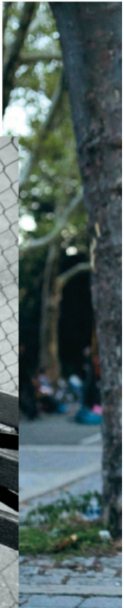
Abito e camicia LOUIS VUITTON , marsupio LOUIS VUITTON/SUPREME . Lei: camicia DOLCE&GABBANA , jeans GUCCI