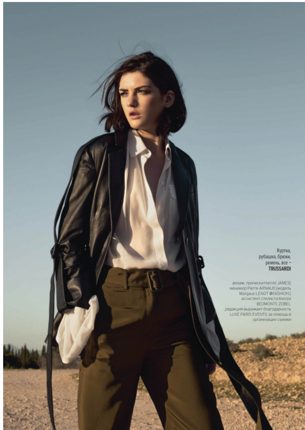
Куртка, рубашка, брюки, ремень, все – TRUSSARDI

визаж, прическа Harold JAMES | маникюр Pierre ARNAUD | модель Margaux LENOT @FASHION | ассистент стилиста Alessia BEOMONTE ZOBEL редакция выражает благодарность LUXE PARIS EVENTS за помощь в организации съемки