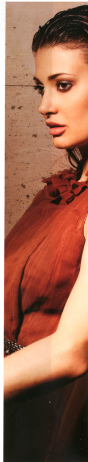
роќа и кожни грѽчи Bottega Veneta om Gardé Robe, кожан ом Premiere, гурвени грѽчи Sinequanone, метљане грѽчи M.O.D.A.V.A.R.