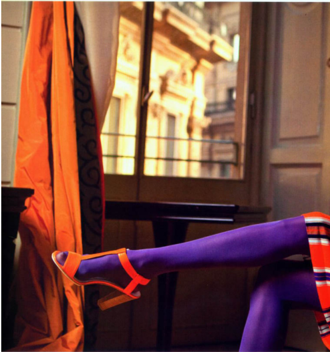
potnik uab u odytku Escada Sport, obovaz Morellato am R.e. d.S.