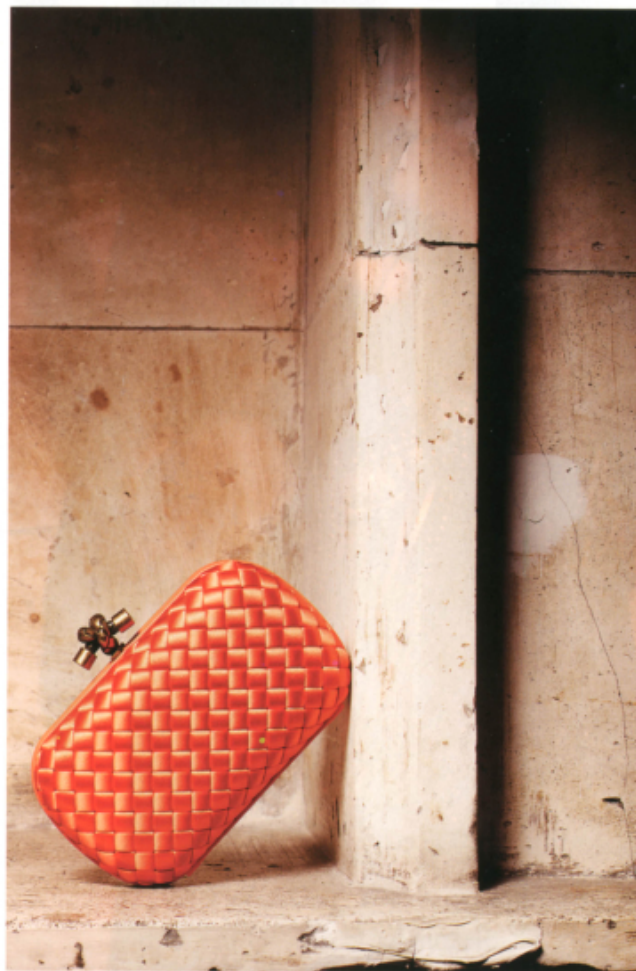
чанта Bottega Veneta om Gardé Robe