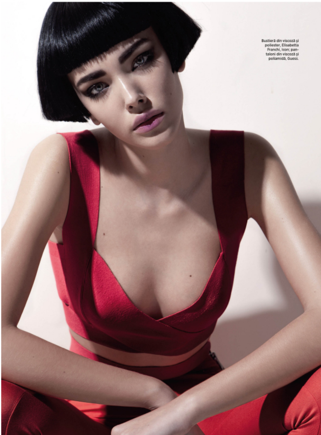
Bustieră din viscoză și poliester, Elisabetta Franchi, Icon; pan- talon din viscoză și poliamidă, Guess.