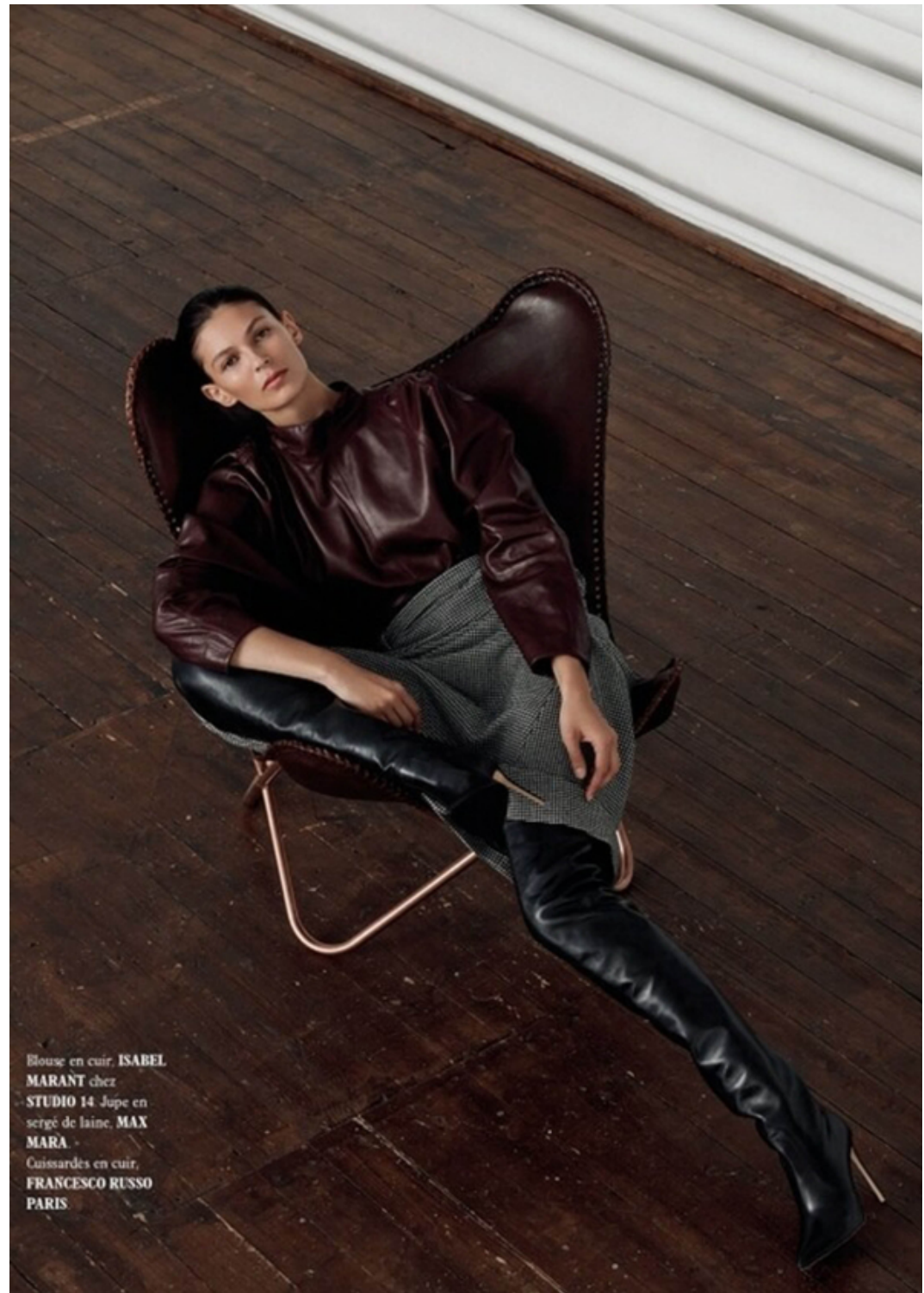
Blouse en cuir, ISABEL MARANT chez STUDIO 14 Jupe en sergé de laine, MAX MARA Cuisseardes en cuir, FRANCESCO RUSSO PARIS