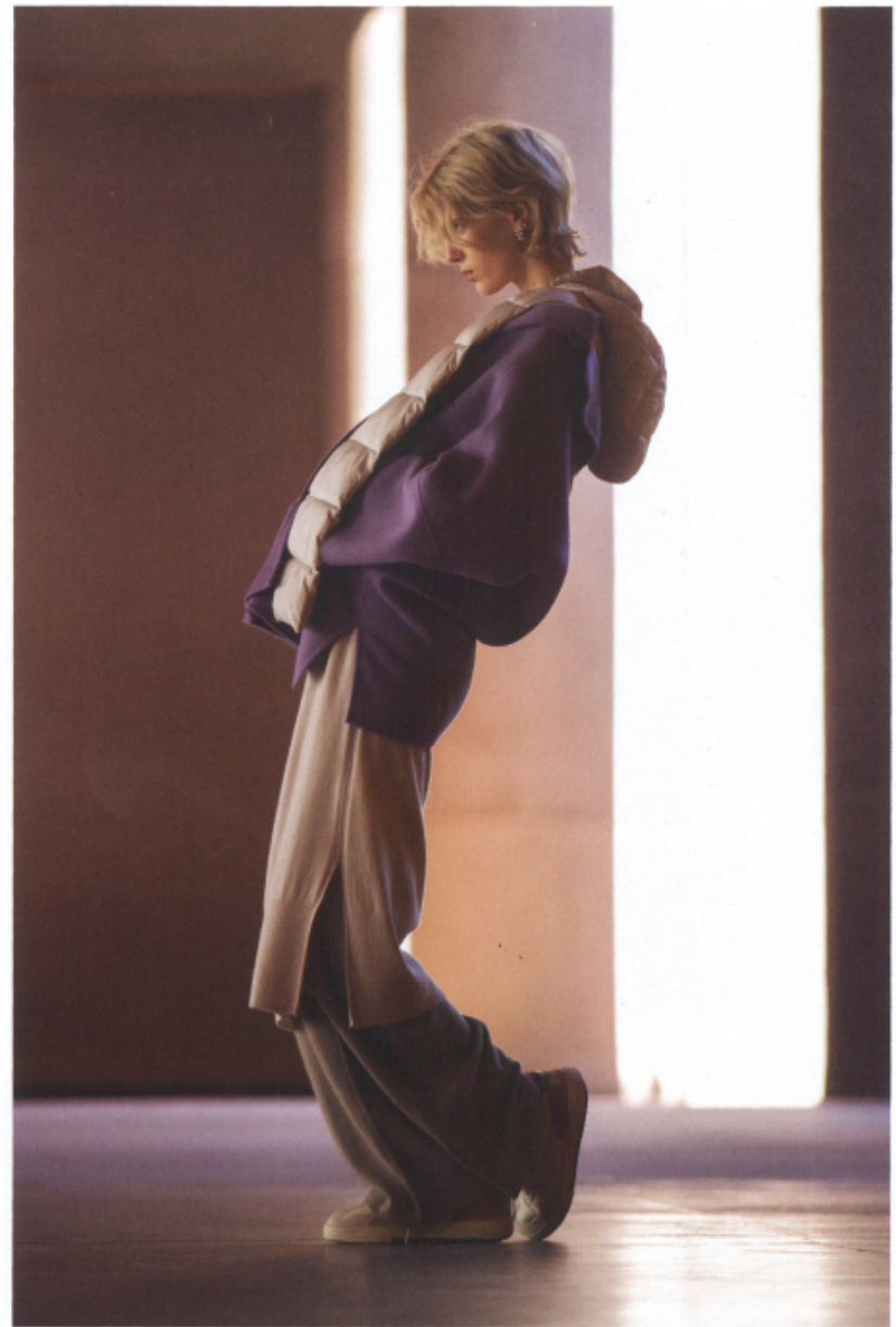
Cappotto in tessuto double, cappuccio-sciarpa imbottito, gonna in lana cardata e pantaloni tricot. Tutto ELENA MIRÒ . Earcuff 4G Pearl con cristalli, GIVENCHY . Sneakers PALM ANGELS . Nella pagina accanto. Giacca in shearling, blazer in twill di lana, pantaloni in denim. Tutto BRUNELLO CUCINELLI .