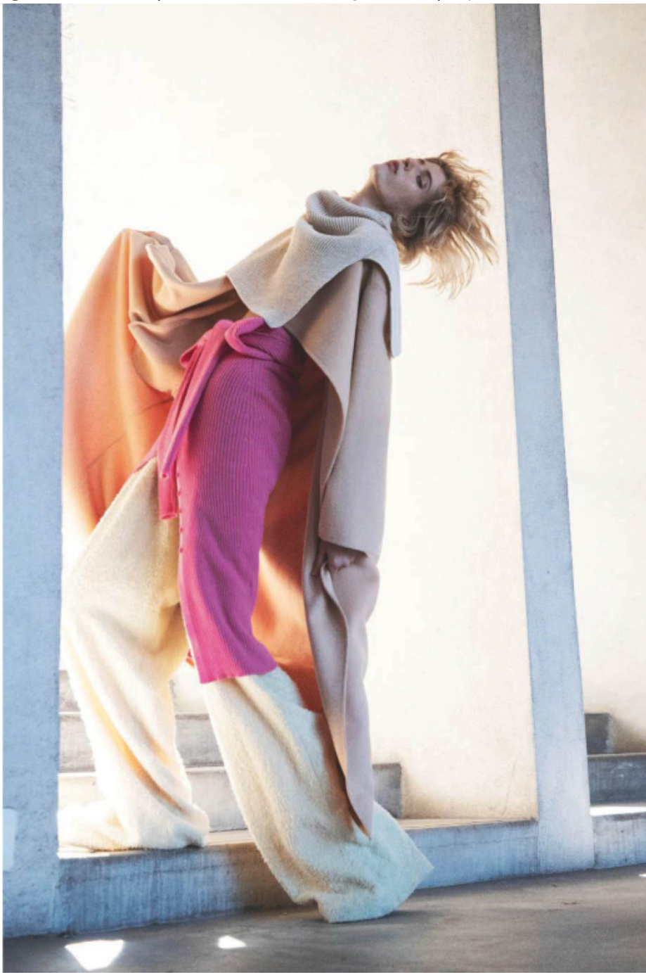
Collo in lana, ACNE STUDIOS . Cappotto in lana, UNITED COLORS OF BENETTON . Abito in lana allacciato in vita, BLUMARINE . Pantaloni in lana bouclé, KRIZIA . Nella pagina accanto. Blazer e pantaloni, MARCIANO BY GUESS . Maglione OVS PIOMBO . Cappello STETSON . Earcuff 4G Pearl con cristalli, GIVENCHY . Calze LUCCI . Sneakers GAZELLE , ADIDAS X GUCCI .