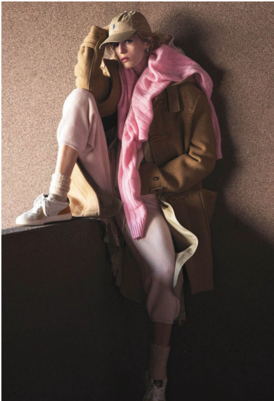
Maglione in cashmere, montgomery in panno di lana, trench in gabardine e cap. Tutto POLO RALPH LAUREN . Pantaloni in cashmere, RLX . Earcuff 4G Pearl con cristalli, GIVENCHY . Calze in cashmere, LORO PIANA . Sneakers PALM ANGELS . Nella pagina accanto. Bomber oversize e abito in lana, ISABEL MARANT . Calze LORO PIANA . Sneakers NIKE .