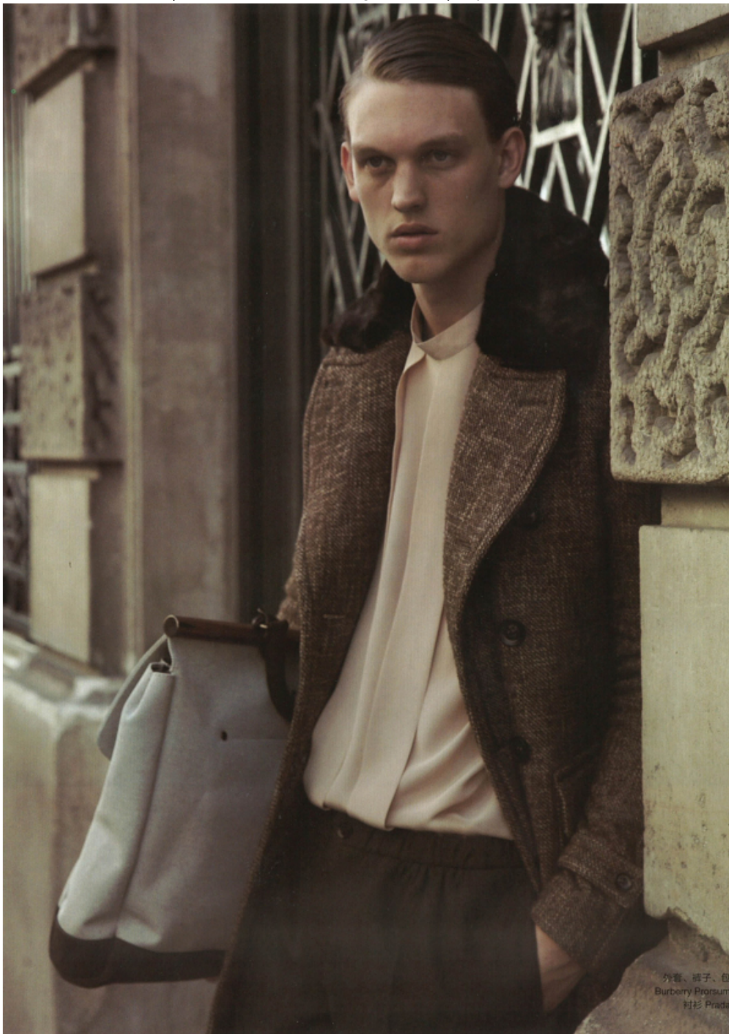
外套、裤子、包 Burberry Prorsum 衬衫 Prada