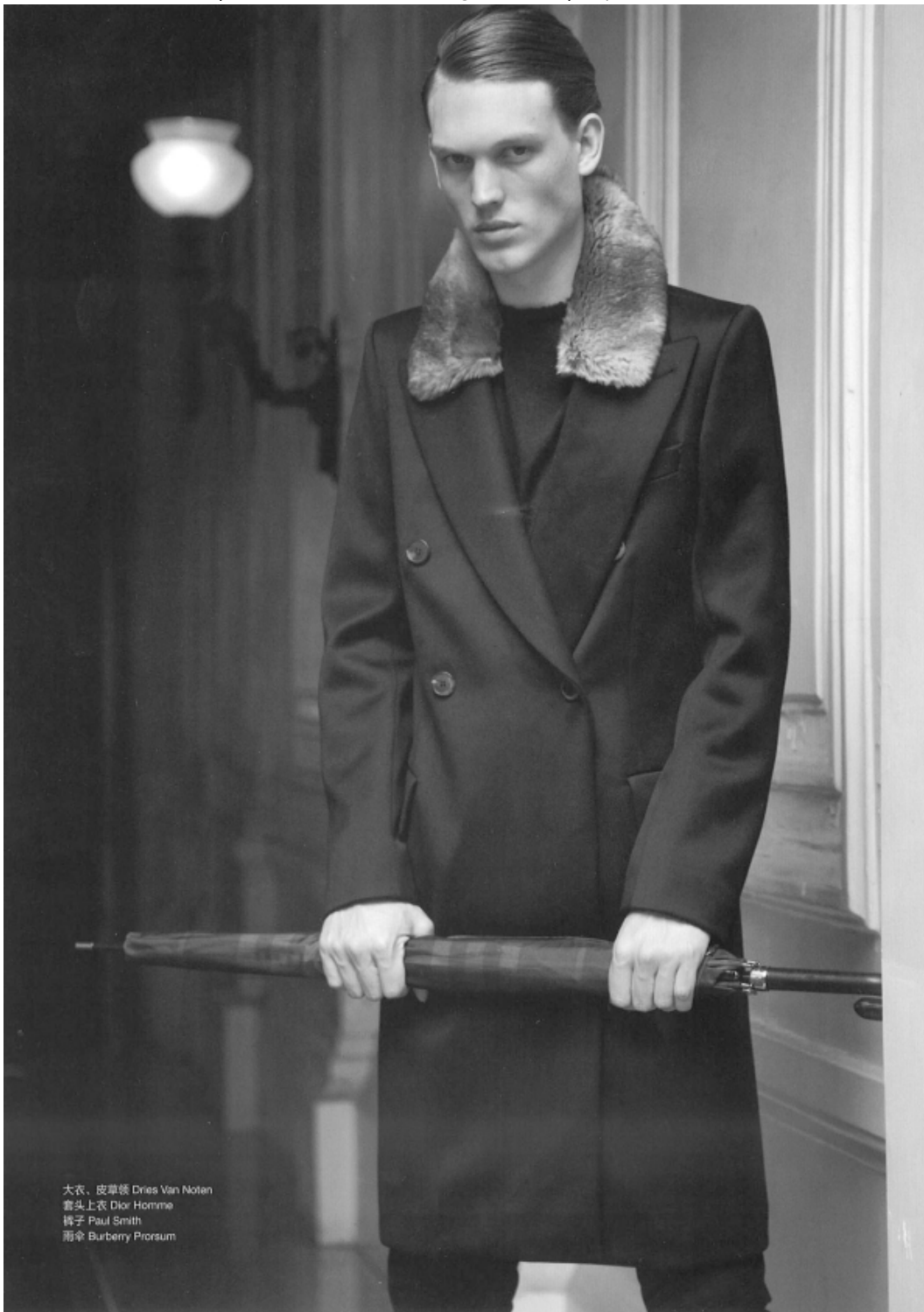
大衣、皮草领 Dries Van Noten 套头上衣 Dior Homme 裤子 Paul Smith 雨伞 Burberry Prorsum