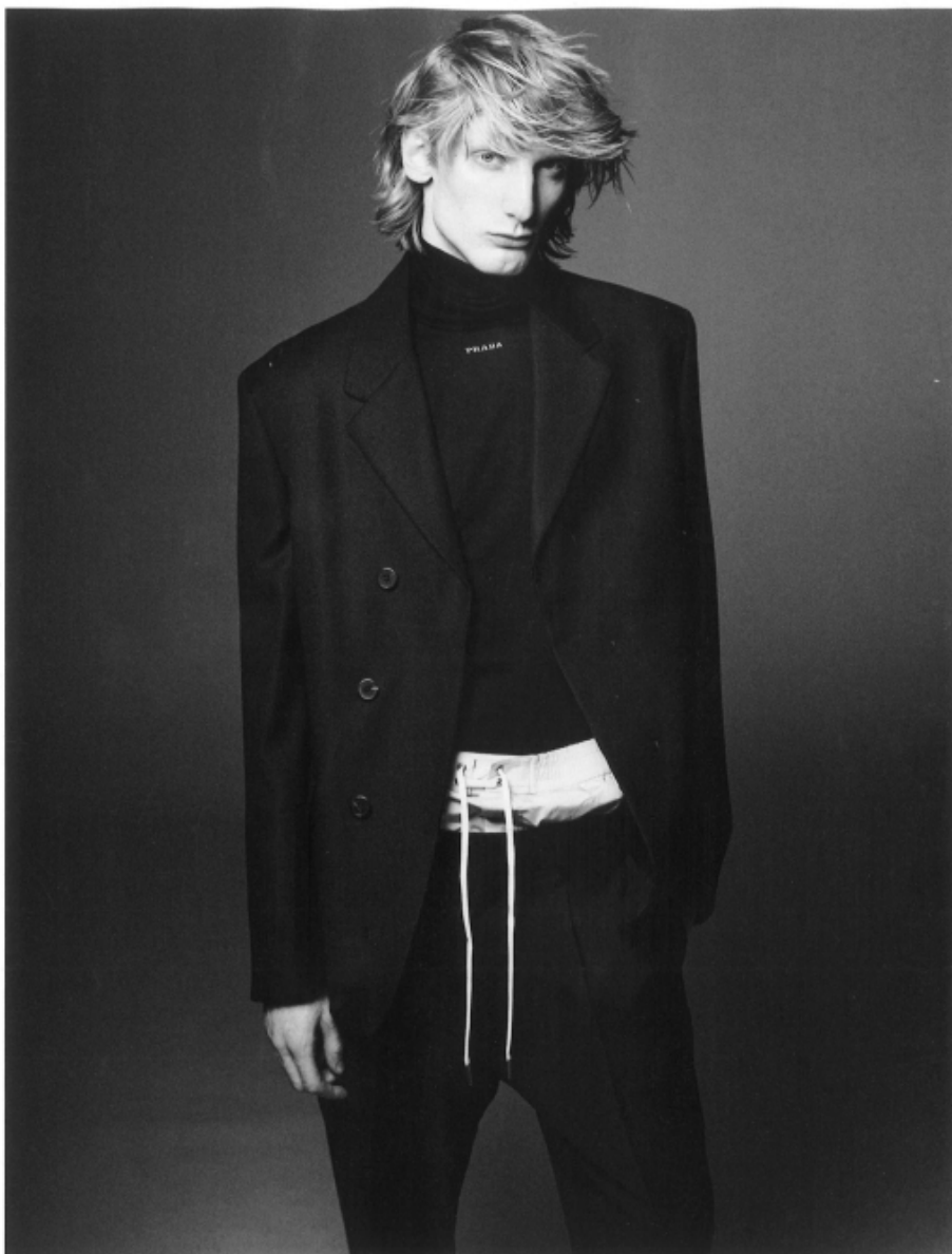
Abito e maglia Prada, costume Dsquared2. Nella pagina accanto, tutto Dsquared2.