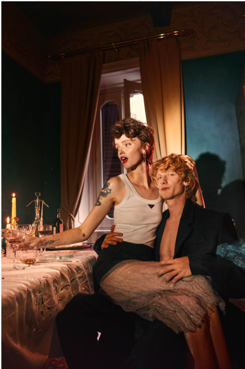
Aia: top e saia, ambos PRADA . Brincos, da produção. Dwight: casaco e calças, ambos PRADA . Na página ao lado, Aia: body e cinto, ambos GIAMBATTISTA VALLI . Brincos, da produção. Lucas: top, calções e lenço, tudo DIOR HOMME . Dwight: camisa, DIOR HOMME . Calças, ACNE STUDIOS .