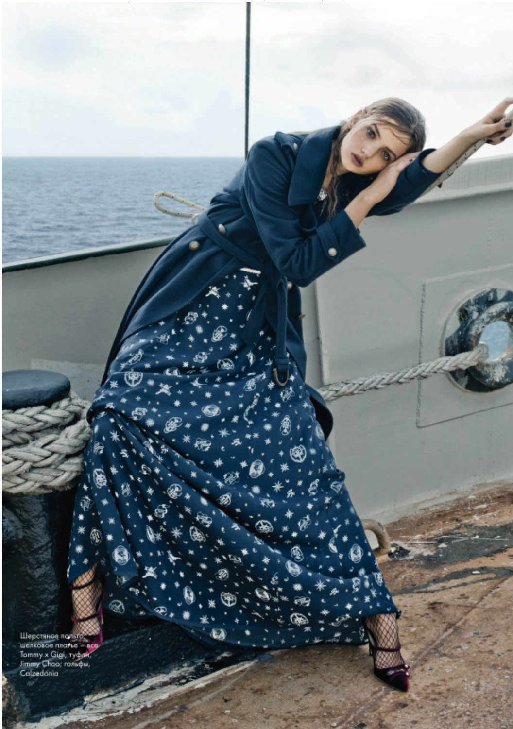
Шерстяное пальто, шелковое платье – все Tommy x Gigi, туфли, Jimmy Choo, гольфы, Calzedonia