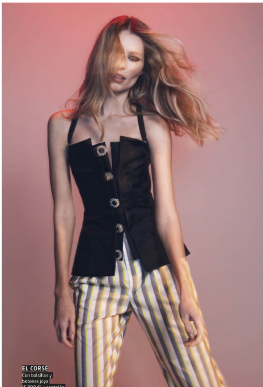
EL CORSE Con bolsillos y botones joya (5.800 €) y pantalón de satén (1.900 €). Todo Louis VUITTON.