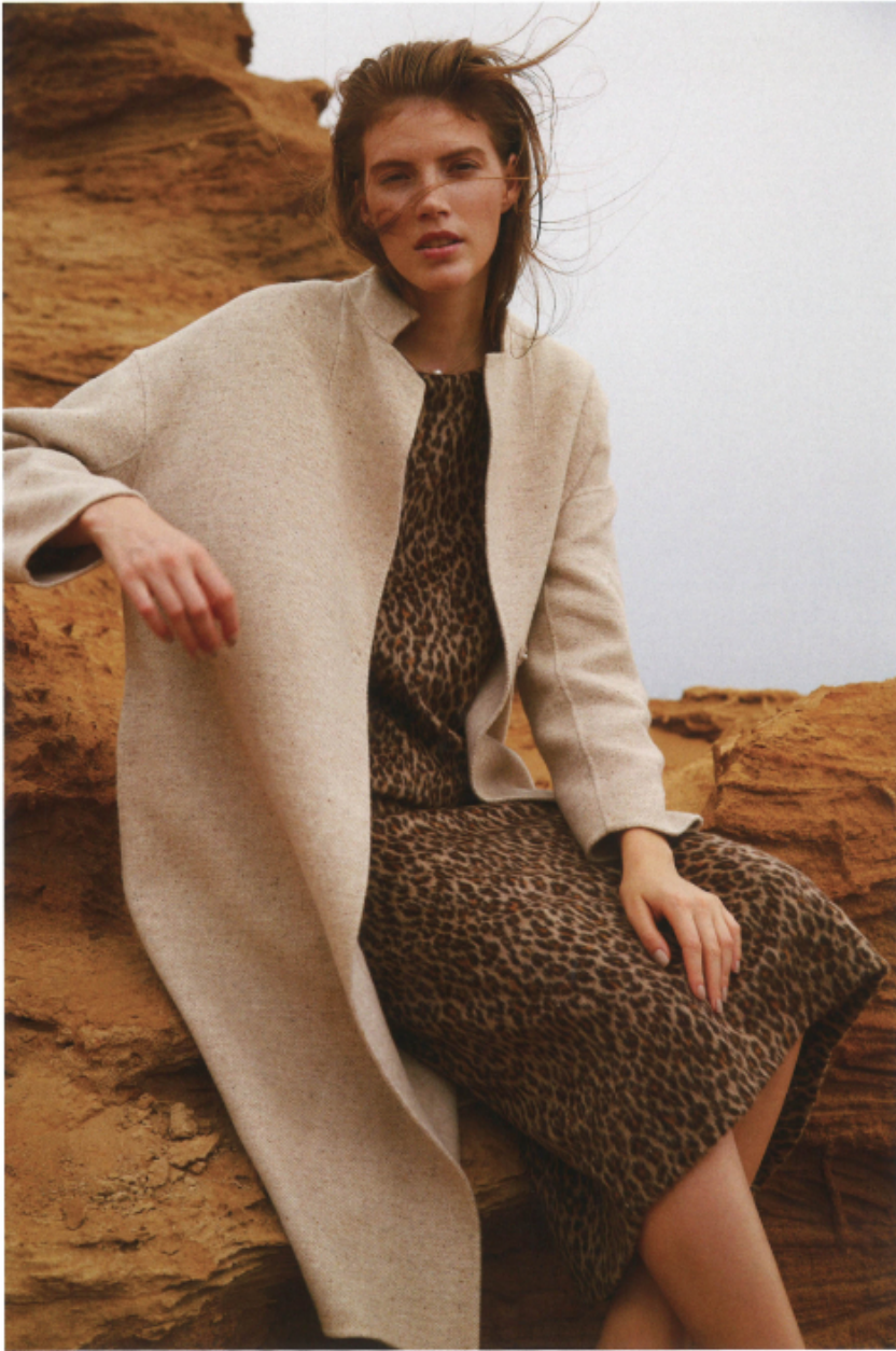
Coat €39,000+tax Tops €11,000+tax Skirt €14,000+tax Necklace €3,500+tax (RIVE DROITE)