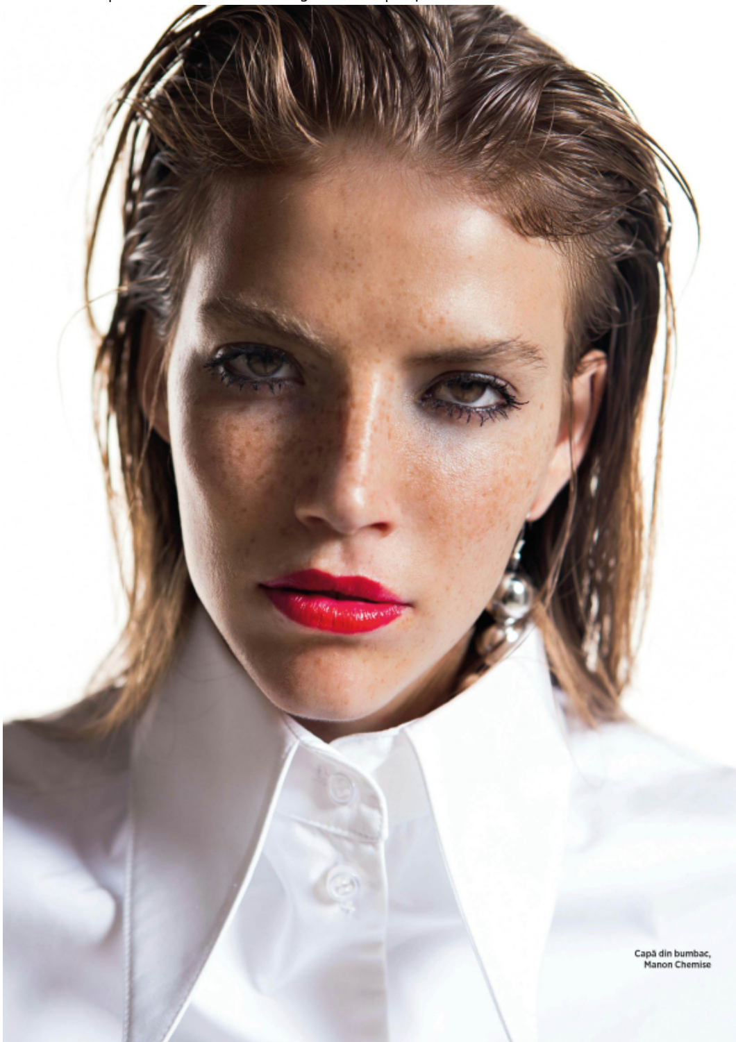
Capă din bumbac, Manon Chemise