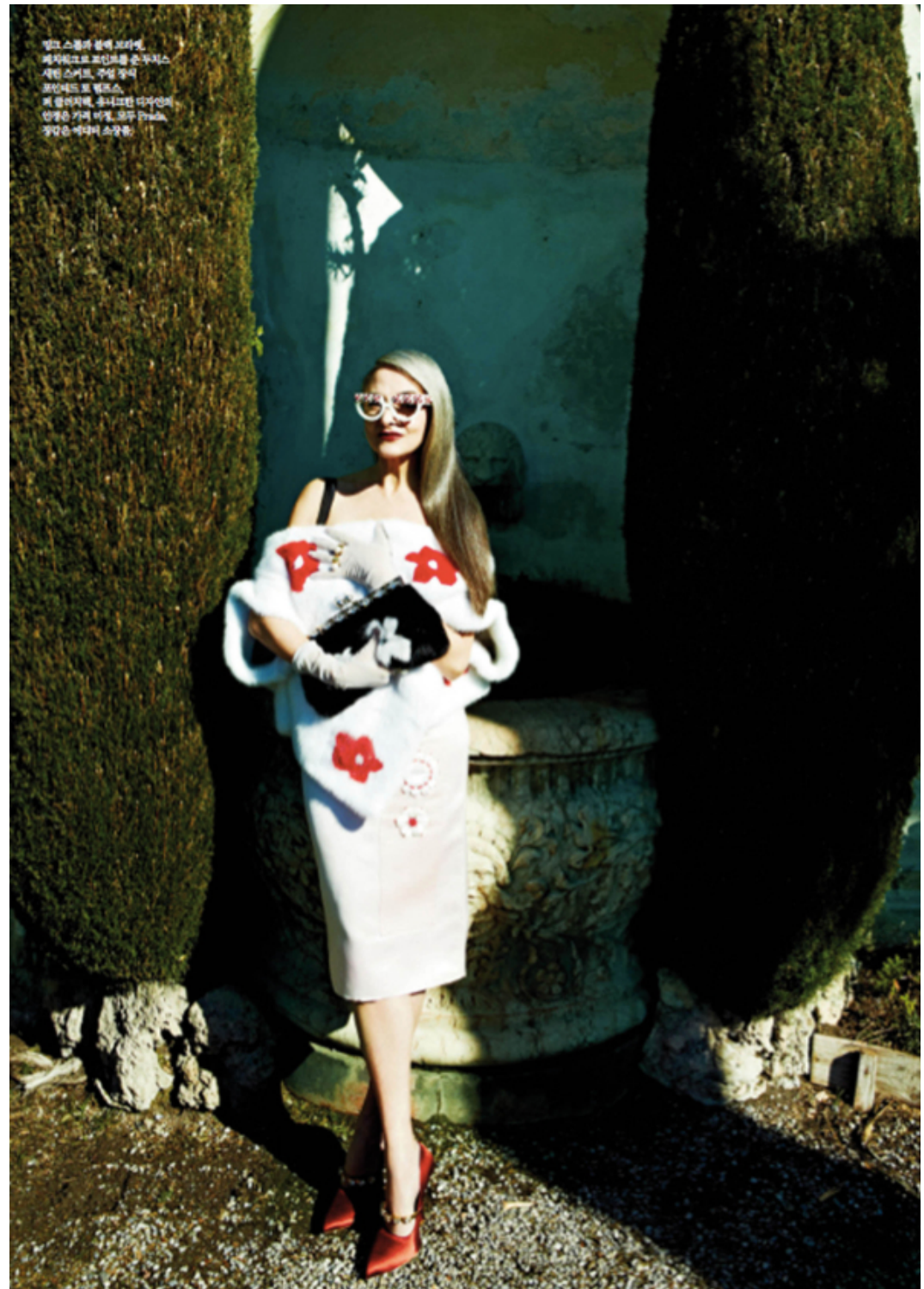
영고 스몰과 볼레 프레이밍, 세틴 벨로스와 세틴 벨로스는 가벼워 미질, Super by Modpop, 부채한 볼레 프레이밍의 안경은 가벼워 미질, 모두 Prada, 정감은 에디터 소장은.