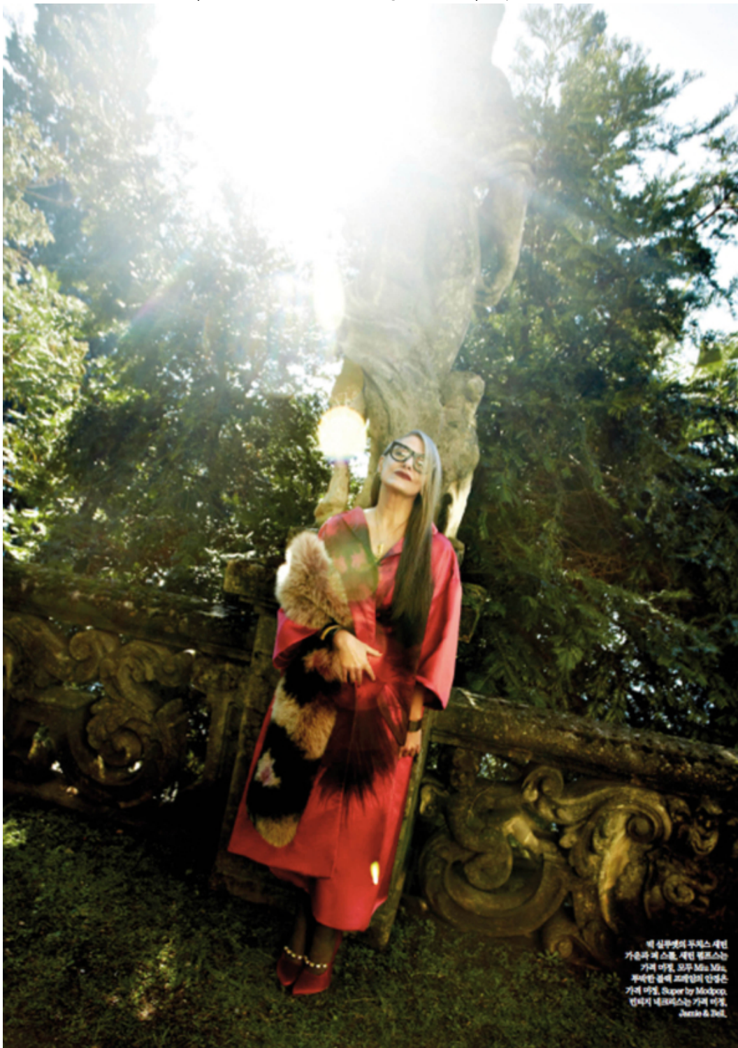
빅 실루엣의 두피스 세틴 가슴과 어깨 스몰, 세틴 벨로스는 가벼워 미질, 모두 Miss Mia, 부채한 볼레 프레이밍의 안경은 가벼워 미질, Super by Modpop, 인위적 네르베스는 가벼워 미질, Jasno & Bell.