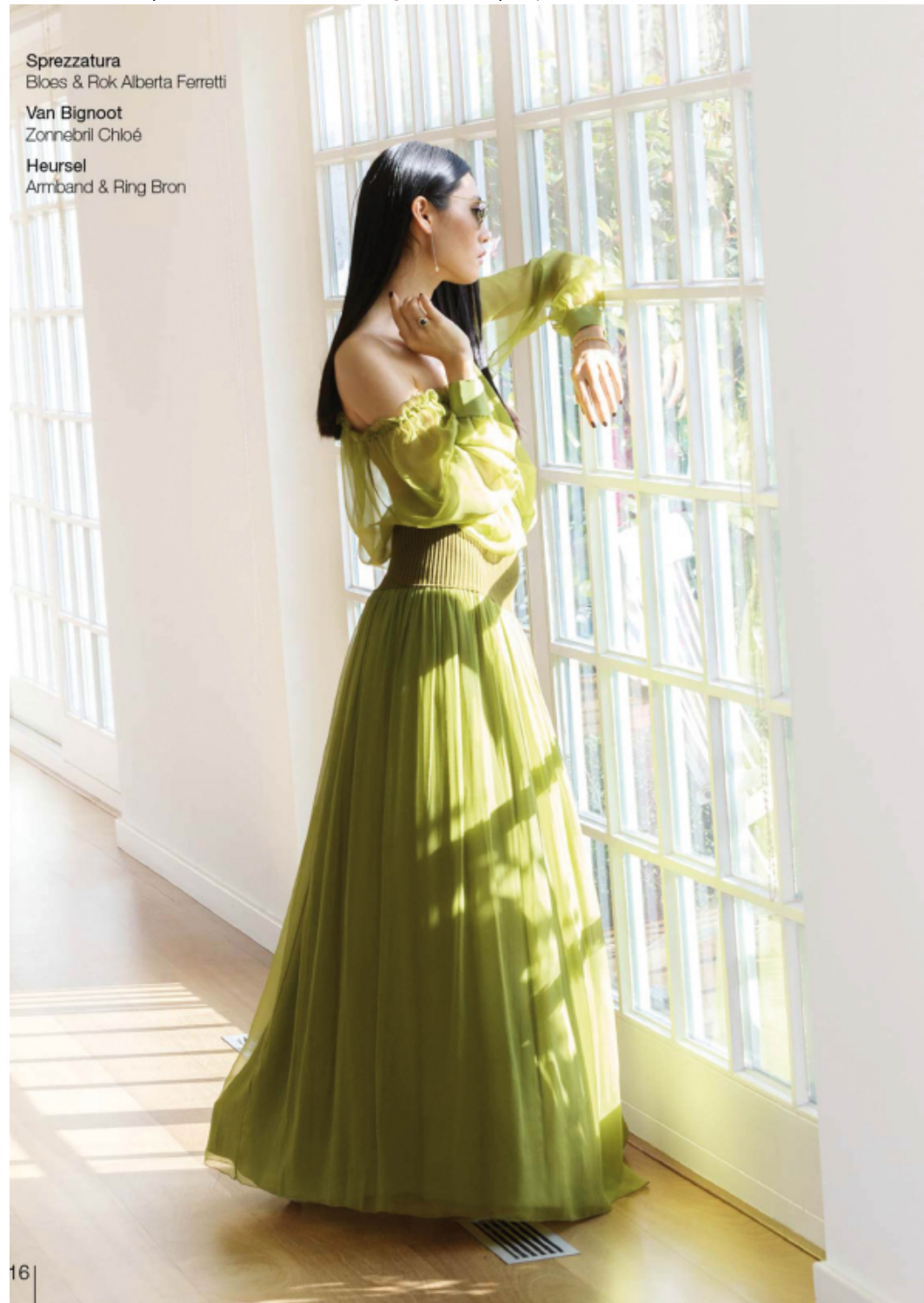
Sprezzatura Bloes & Rok Alberta Ferretti Van Bignoot Zonnebril Chloé Heursel Armband & Ring Bron