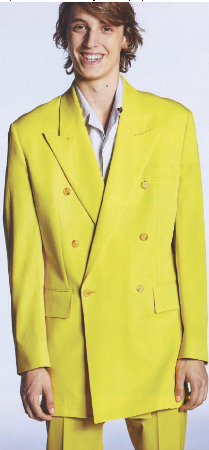
DI LUCA ROSCINI - FOTOGRAFIA: ANDRE CUETO SAUVEDRA © DRENCALENTERRAS