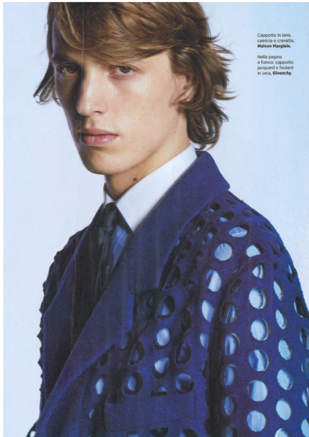
Cappotto in lana, camicia e cravatta, Maison Margiela.