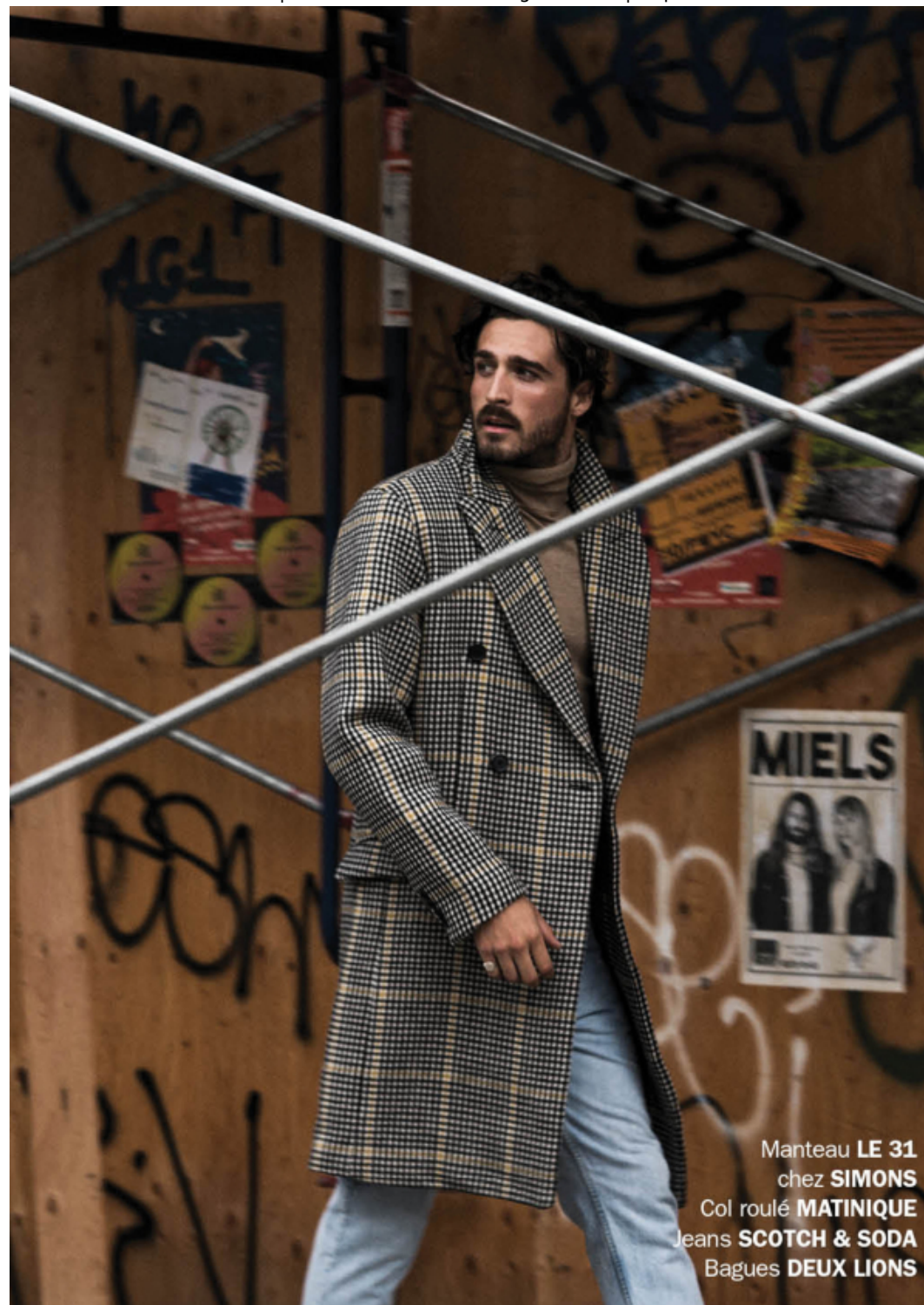
Manteau LE 31 chez SIMONS Col roulé MATINIQUE Jeans SCOTCH & SODA Bagues DEUX LIONS