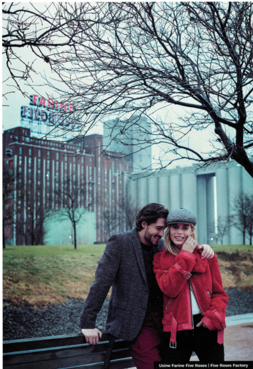
Usine Farine Five Roses | Five Roses Factory

Pour elle : blouson (Wolffie Furs), pantalon (Lola Jeans), casquette (Ricardo BH). Pour lui : veston (Citadin), chandail (Projek Raw), pantalon (Philippe Dubuc). On her: jacket (Wolffie Furs), pants (Lola Jeans), cap (Ricardo BH). On him: Jacket (Citadin), shirt (Projek Raw), pants (Philippe Dubuc).