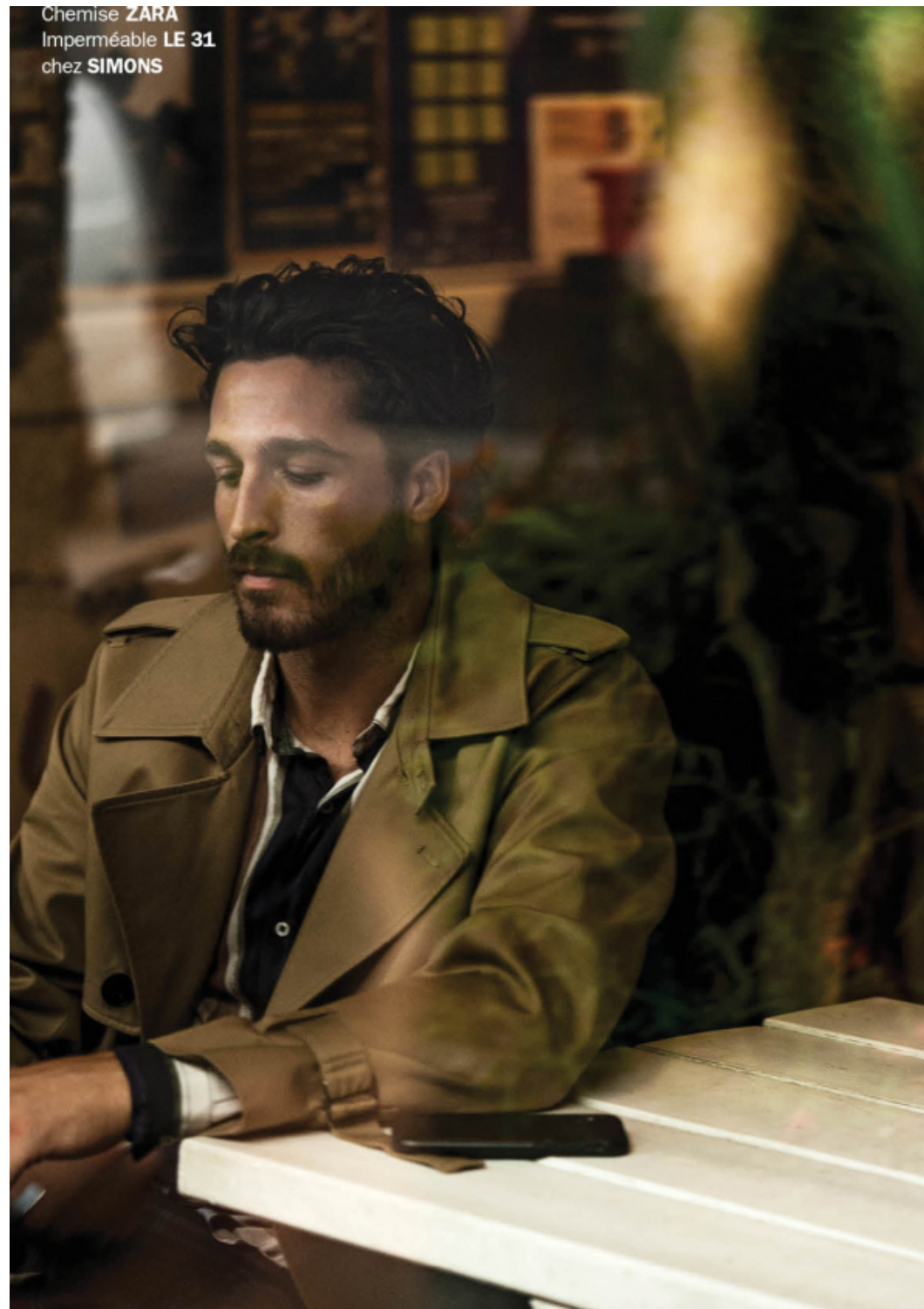
Chemise ZARA Imperméable LE 31 chez SIMONS