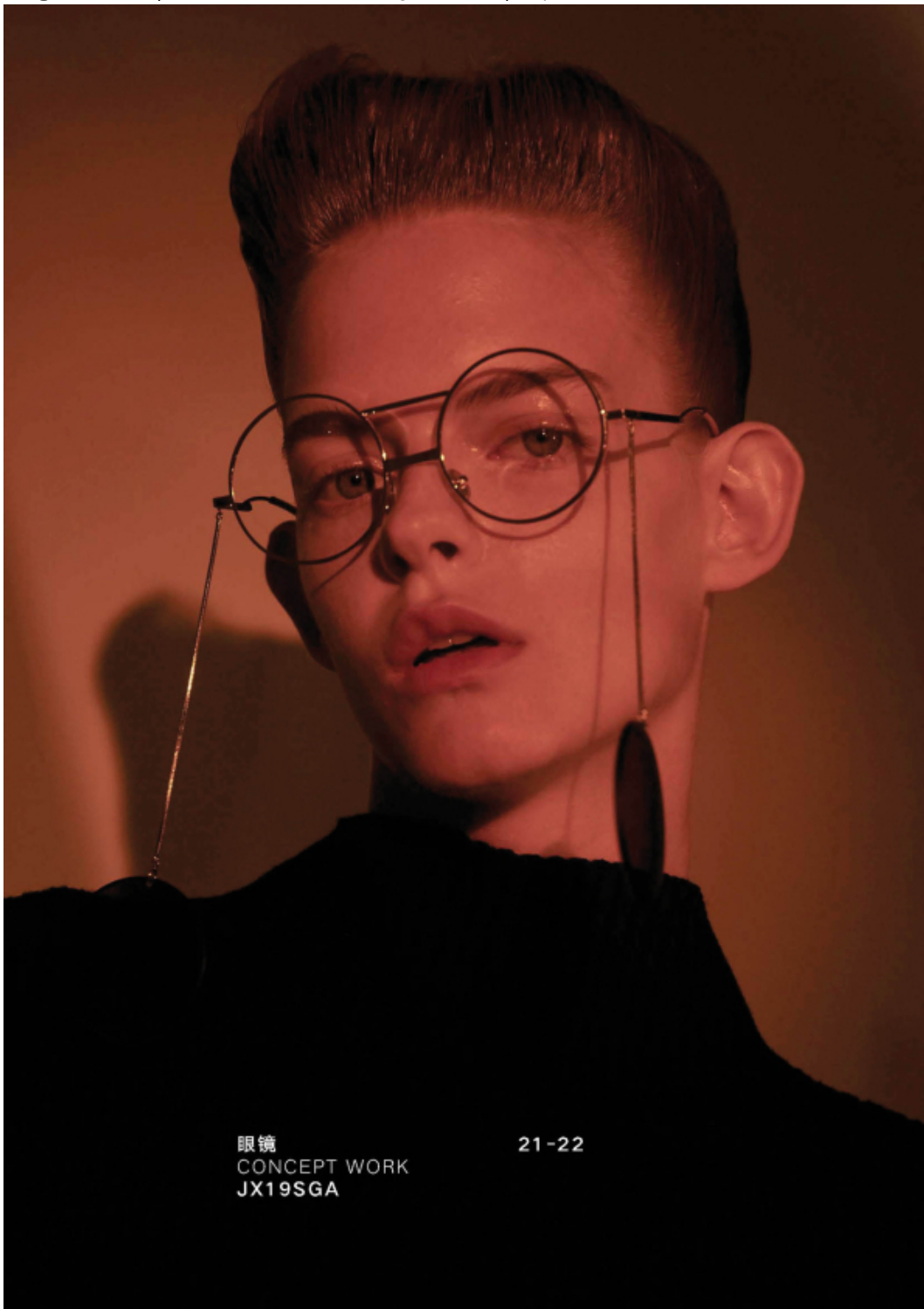
眼镜 CONCEPT WORK JX19SGA