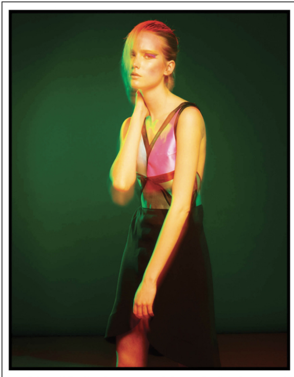
Dress : Giorgio Armani