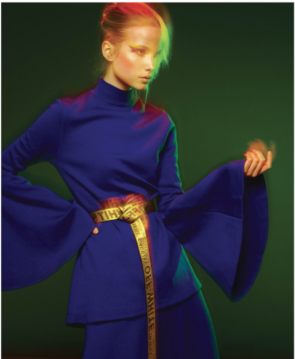
Turtleneck jersey : Pringle of Scotland Skirt : Pringle of Scotland Belt : Off-White