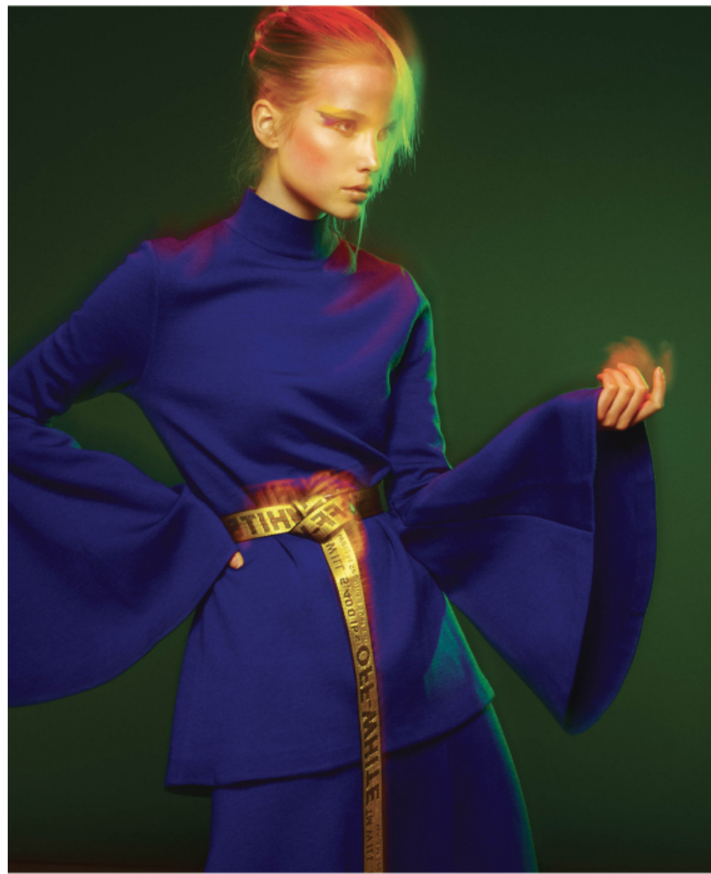
Turtleneck jersey : Pringle of Scotland Skirt : Pringle of Scotland Belt : Off-White