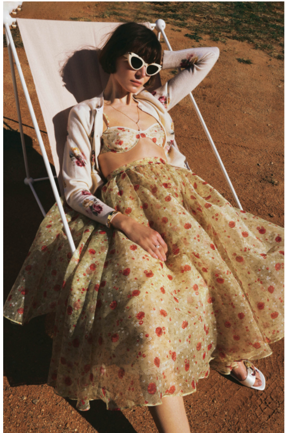
Bedeckte Strickjacke aus einem Woll-Mix, weiler Tüllrock mit floralem Muster, passender Unterrock, Biegel-BH, satinierte Sandaletten; alles Prada . Cat-Eye-Sonnenbrille: Alexander McQueen . 14-karätig vergoldete Kette mit Süßwasserzuchtperlen, skulpturaler Armband „Essence“; beides Pandora .