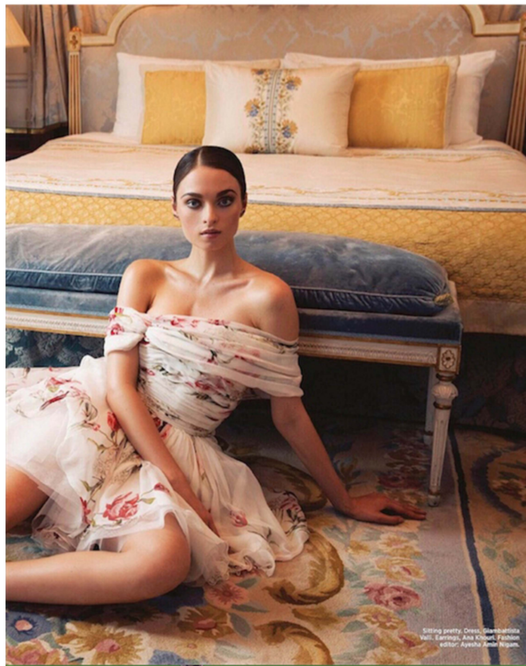
Sitting pretty. Dress, Giambattista Valli. Earrings, Ana Khourl. Fashion editor: Ayesha Amel Nigam.