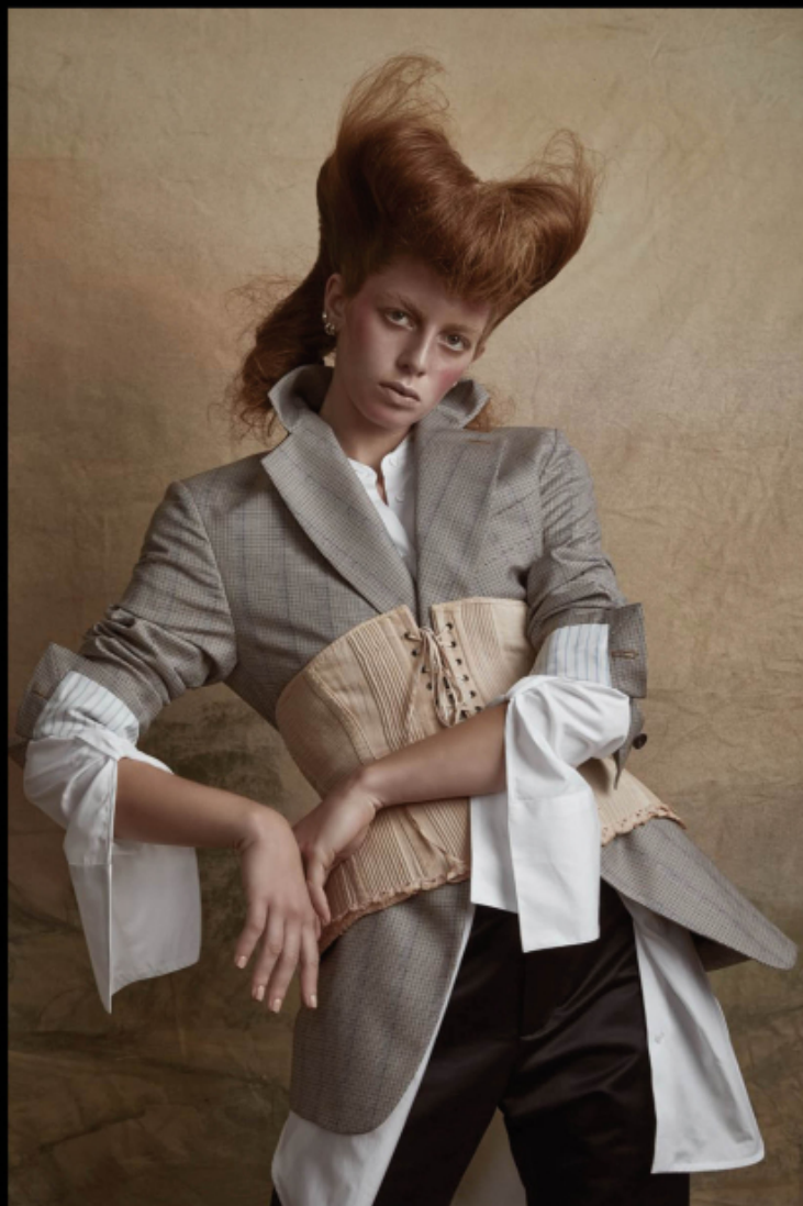
Jacket and satin pants, VIVIENNE WESTWOOD . Shirt, DONDUP . Corset, MADAME PAULINE VINTAGE .