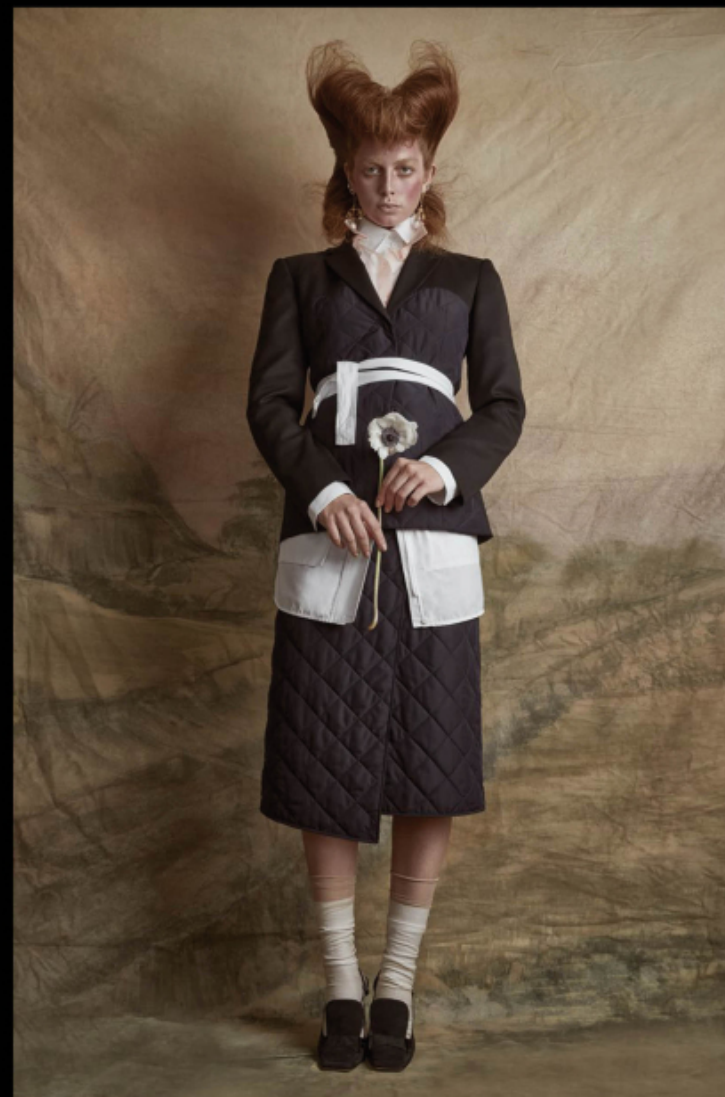
Puffer jacket and skirt, COLIAC . Cotton shirt and belt, SPORTMAX . Sheer shirt, MAJE . Earrings, TORY BURCH . Suede pumps, FENDI .