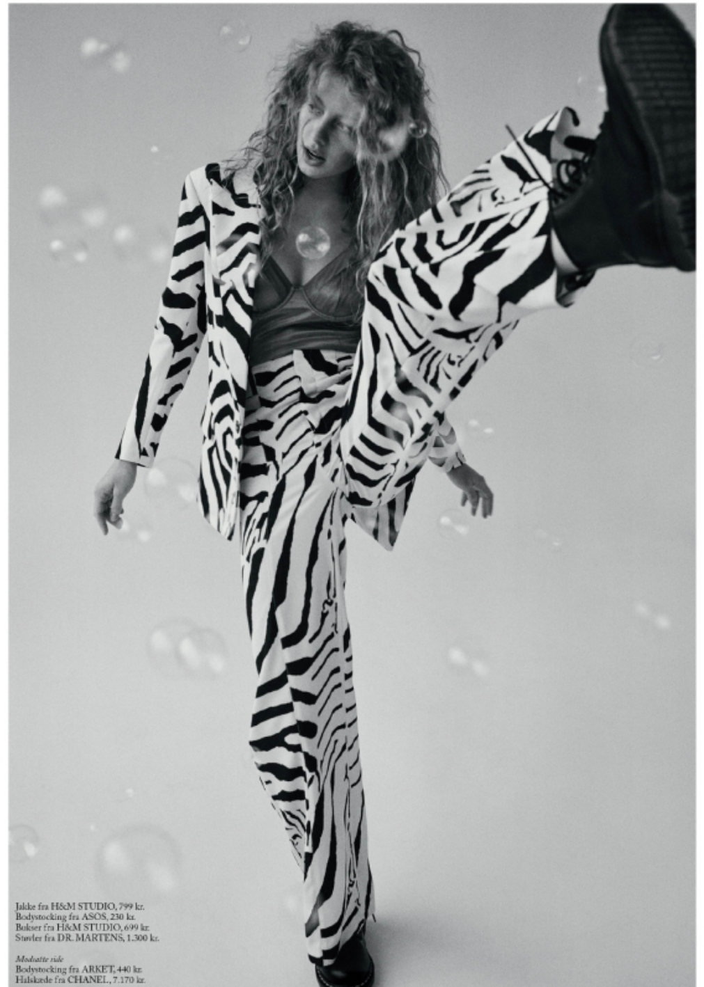
Jakke fra H&M STUDIO, 799 kr. Bodystocking fra ASOS, 230 kr. Bukser fra H&M STUDIO, 699 kr. Støvler fra DR. MARTENS, 1.300 kr.