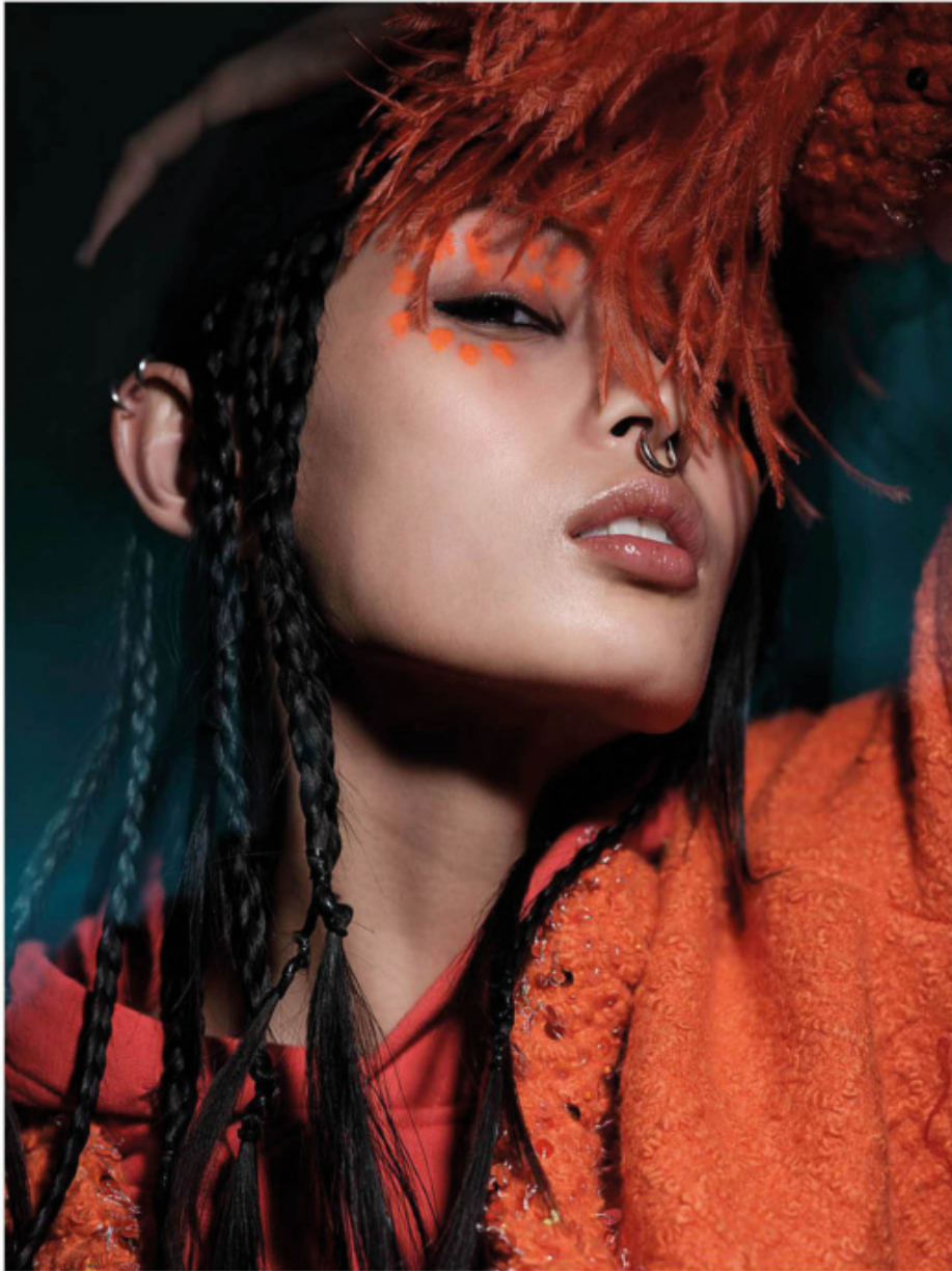
Orange tweed little jacket with feathers on the sleeves Hooded sweatshirt VALENTINO

GUCCI serum de beauté' fluide soyeux Eyes: GUCCI lipstick Agatha nr 302 + stylo contour des yeux black Lips GUCCI Eclat de beauté effect Lumiere yeux et levres