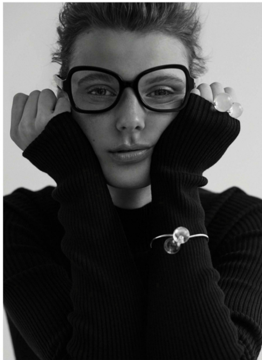
GLASSES PRADA, TOP & OTHER STORIES, BRACELET & RING SASKIA DIEZ