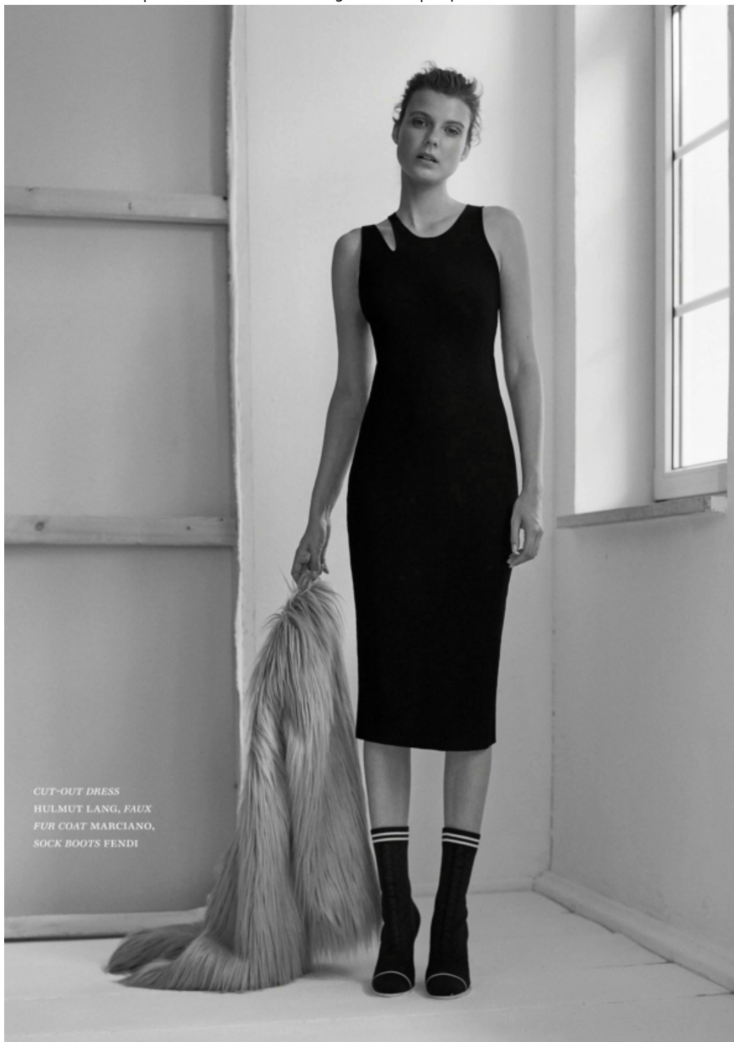
CUT-OUT DRESS HULMUT LANG, FAUX FUR COAT MARCIANO, SOCK BOOTS FENDI