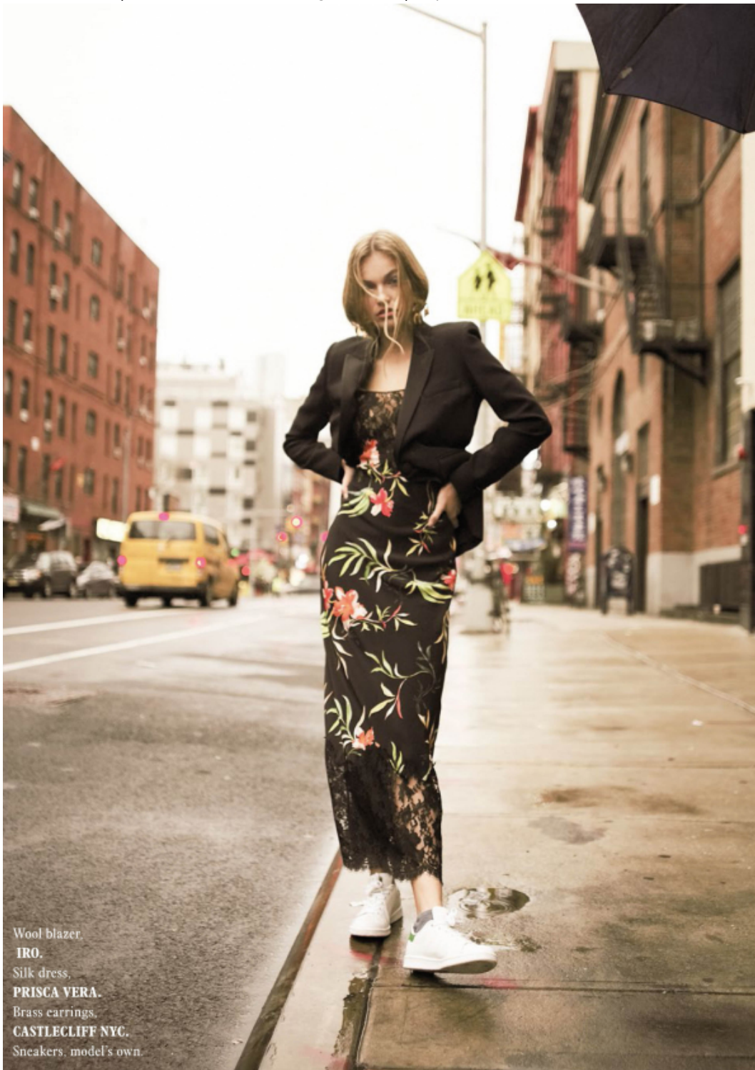
Wool blazer. IRO. Silk dress, PRISCA VERA. Brass earrings, CASTLECLIFF NYC. Sneakers, model's own.