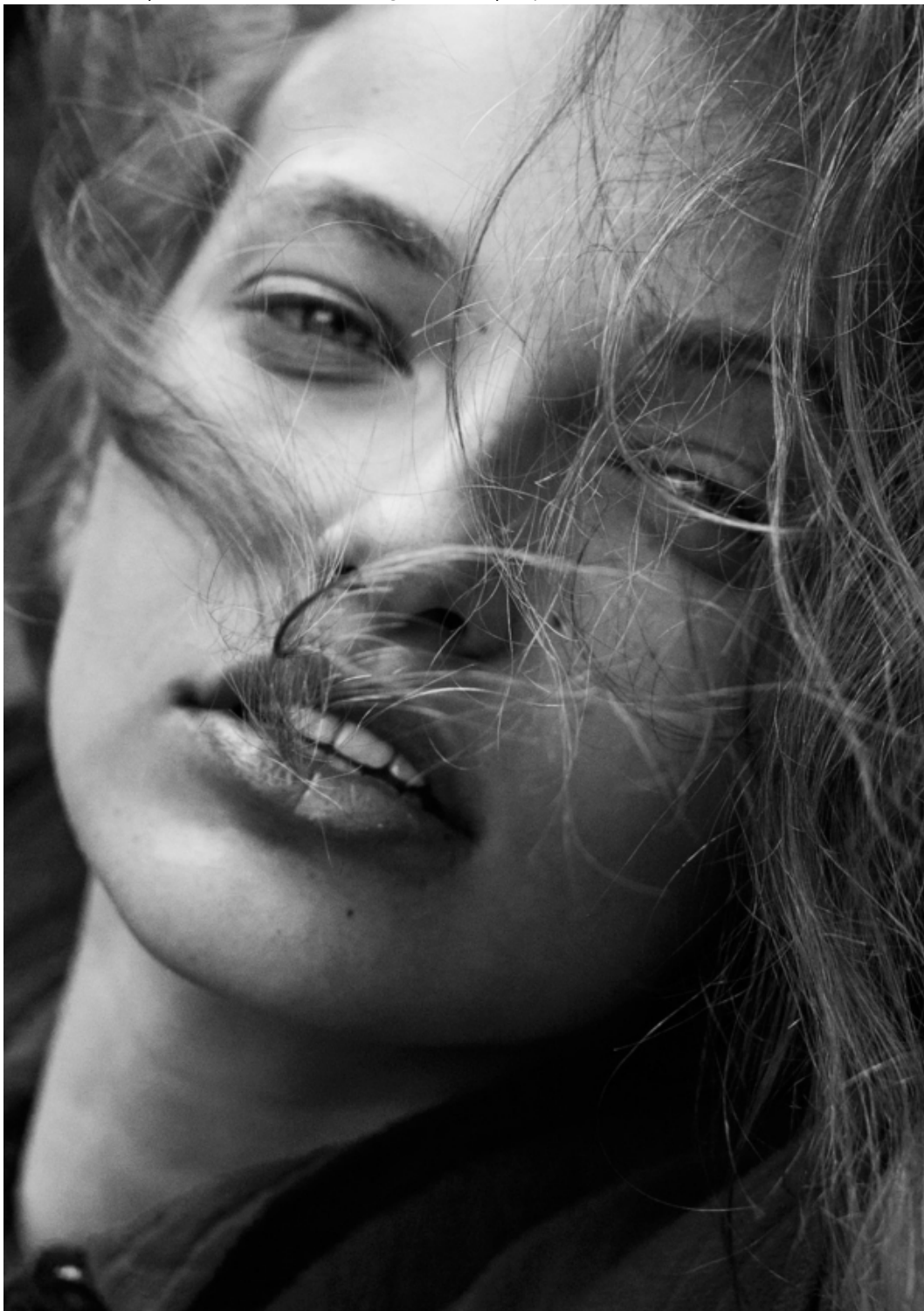
Hair & Make-up: Cecilia Jachere mit Produkten von Baber und L'Oréal Paris; Models: NoorFotograf.de und TopFoto; Photo: modish.de; Produktionsfirma: Hannah Jobs