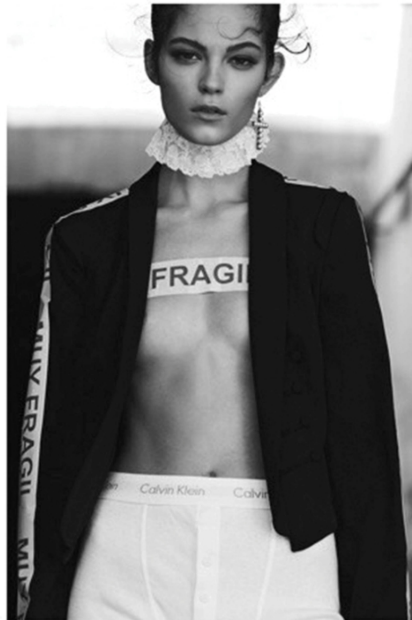
vintage lace neck L'ARCA / earring BERSHKA / vintage blazer LESWING / underwear CALVIN KLEIN