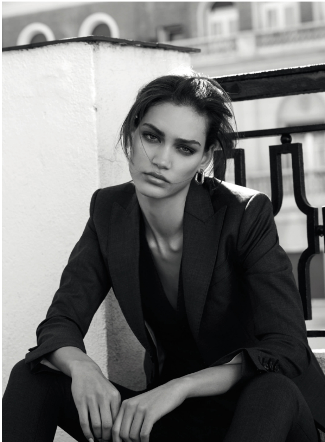
Total Look Dequared2, Earrings Glenda Lopez.