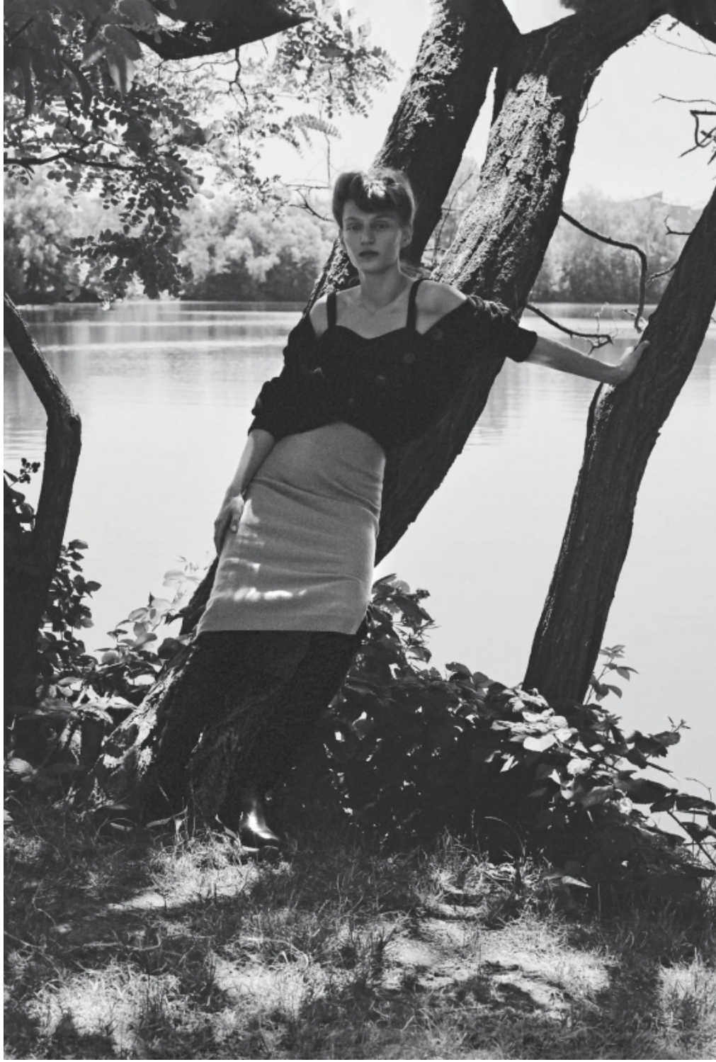
Cardigan e top di lana, Luisa Spagnoli. Gonna di lana stretch, Pennyblack. Stivali di pelo, Erika Cavallini.