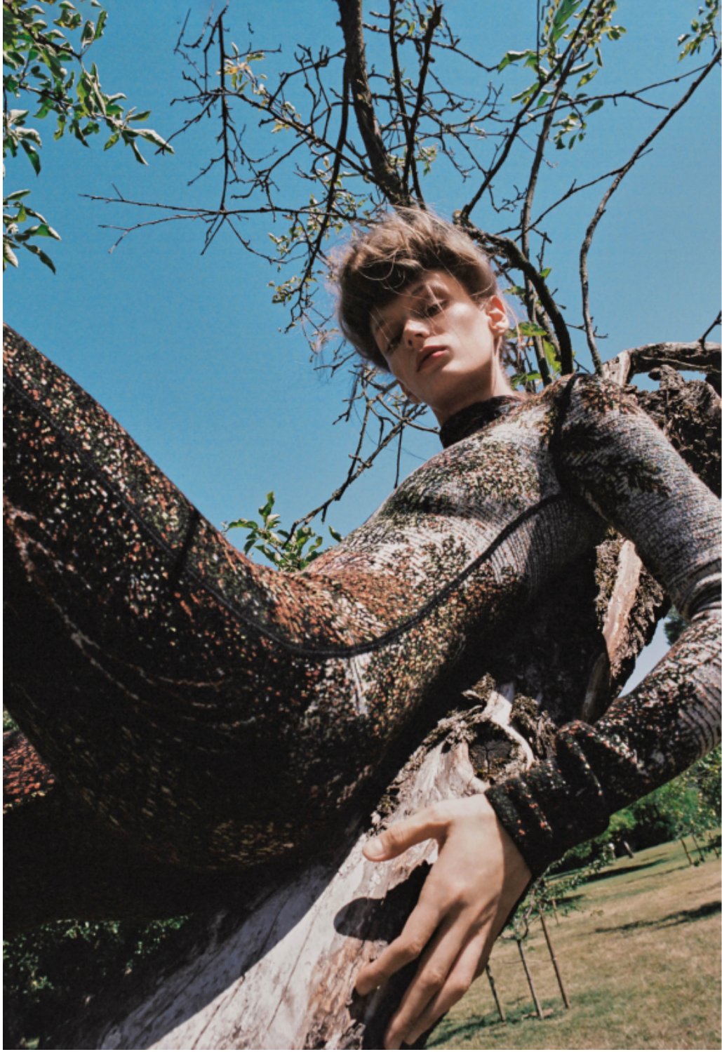
Tuta di velluto, seta e lana jacquard, Kenzo.