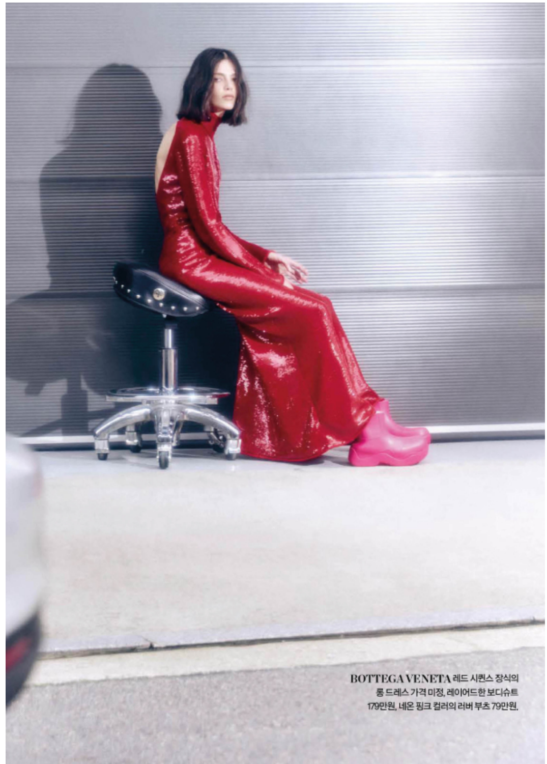
BOTTEGA VENETA 레드 시퀀스 장식의 폼 드레스 가격 미정, 레이어드한 보디슈트 179만원, 네온 핑크 컬러의 러버 부츠 79만원.