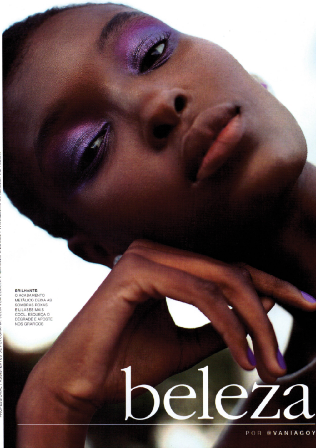
FOTO: KARINE BASILIO / BELEZA; DINDI HOJAH / PRODUÇÃO-EXECUTIVA; VANÍDECA ZIMMERMANN / MODELOS; GIOVANNA DI COLA (MEGA MODEL) E MARIA OLIVEIRA (WAY MODEL) / ASSISTENTE DE BELEZA; BRUNO BERAZI COM PRODUTOS NYX COSMETICS E SEBASTIAN PROFESSIONAL / ASSISTENTES DE FOTOGRAFIA; JULIA VON ZEIDLER E MARCELO ANDRADE / TRATAMENTO DE IMAGEM; WM FUSION

BRILHANTE O ACABAMENTO METÁLICO DEIXA AS SOMBRA ROXAS E LILASES MAIS COOL. ESQUEÇA O DEGRADÉ E APOSTE NOS GRÁFICOS