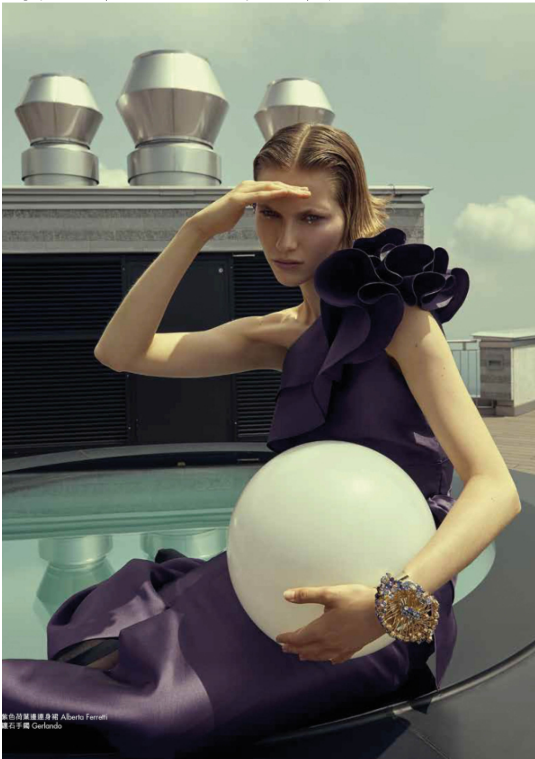
紫色荷葉邊連身裙 Alberta Ferretti 鑽石手鐲 Gerlando