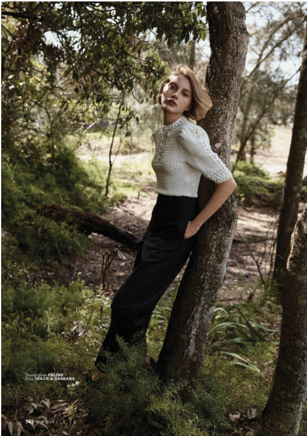
Trang phục CELINE Giày DOLCE & GABBANA

CẢM HỨNG THỜI TRANG BAY BÓNG ĐƯA BẠN ĐẾN NHỮNG ĐỊA DANH DÁNG MƠ ƯỚC