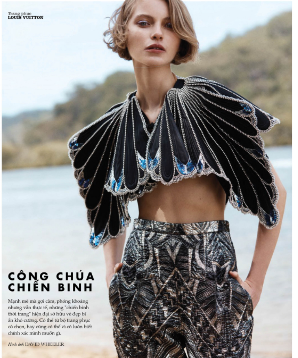
Trang phục LOUIS VUITTON