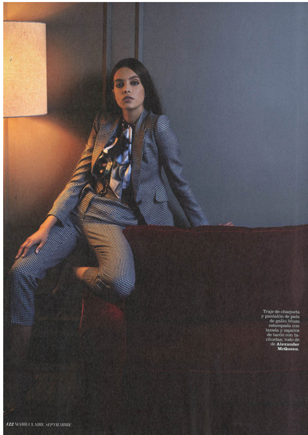
Traje de chaqueta y pantalón de pata de gallo; blusa estampada con lazada y zapatos de tacón con tachuelas; todo de Alexander McQueen .