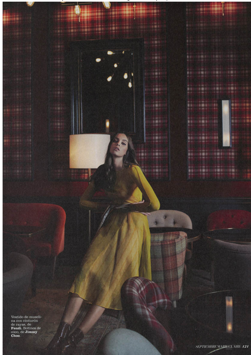
Vestido de muselina con cinturón de rayas, de Fendi . Botines de coco, de Jimmy Choo .