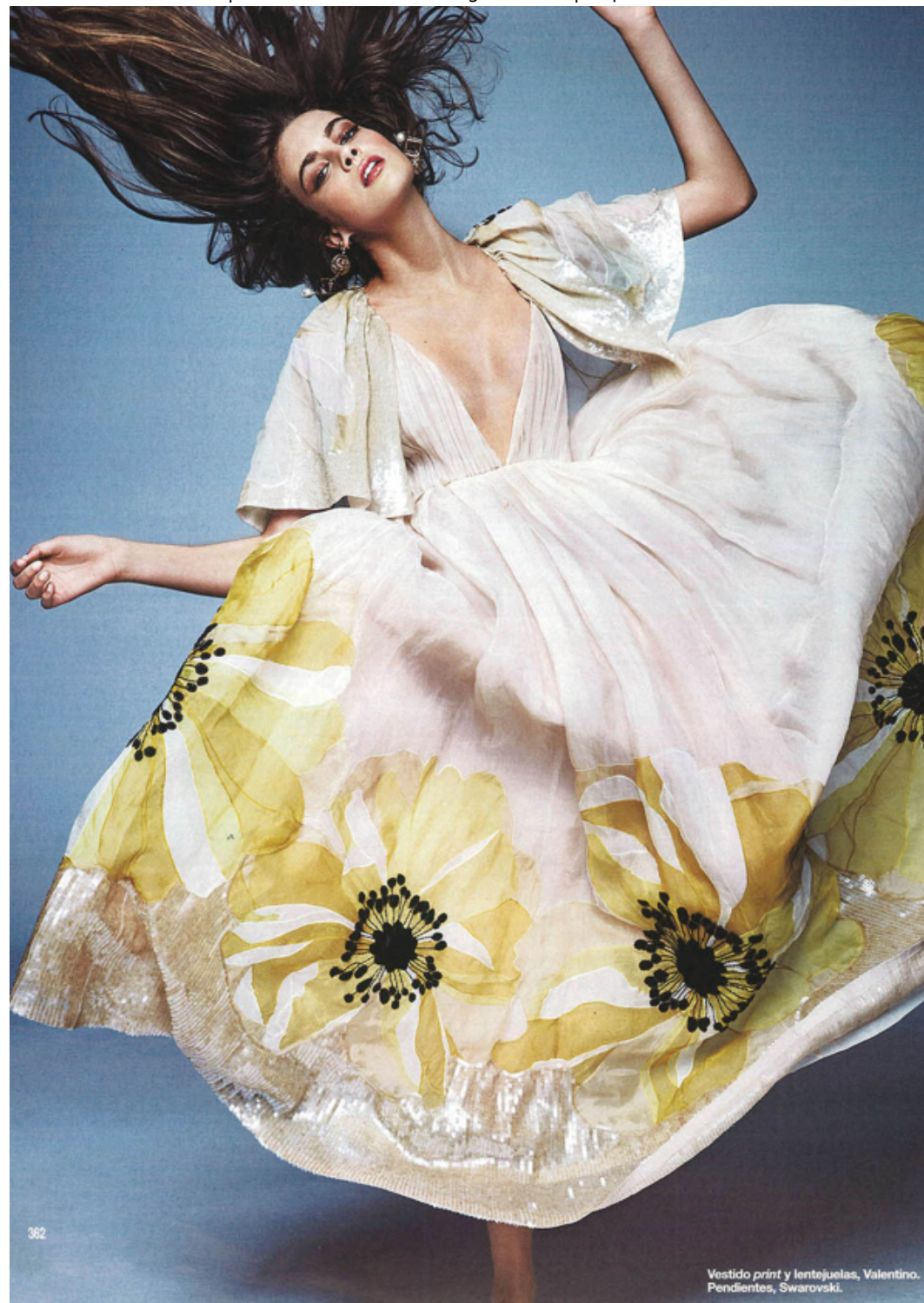
Vestido print y lentejuelas, Valentino. Pendientes, Swarovski.