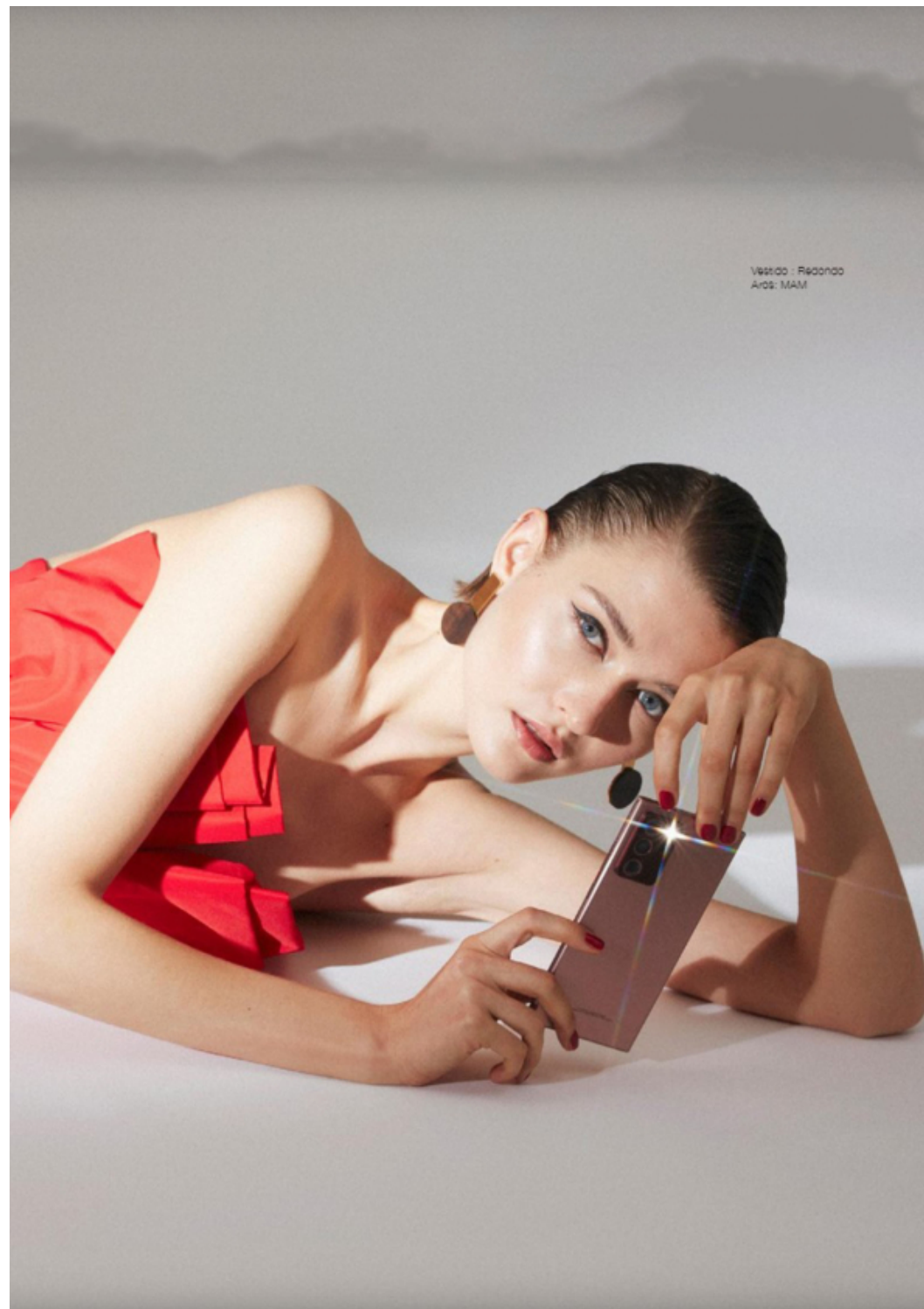
Make up y pelo: Maya Bayer Styling: Macarena Hamilton Asistente: Francisca Farias Modelo: Elite Model

Más que un teléfono, el nuevo Galaxy Note20 Ultra de Samsung es un imprescindible y un auténtico objeto de deseo. Favorito de fashion influencers de todo el mundo, es el protagonista de esta sesión inspirada en una mujer moderna y cosmopolita.