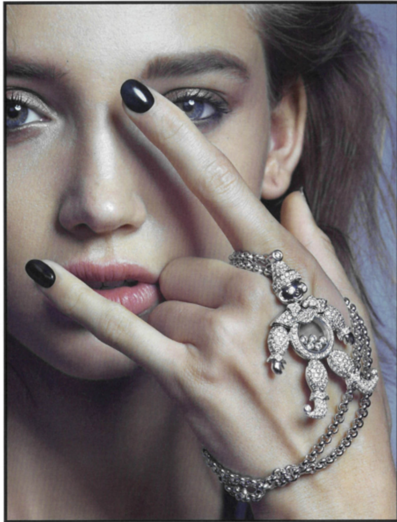
PAGE DE GAUCHE. Pendentif Happy Diamonds Crown en or blanc 18K et serti de diamants, Chopard.

PAGE DE DROITE. Lunettes de soleil Maxi, Moncler. Robe en jersey lurex à épaulettes, Nenette. Boucles d'oreilles Happy Hearts en or rose éthique 18K, diamants et nacre. Main droite : bracelet Jonc Happy Spirit en or rose éthique 18K , or blanc éthique et diamants, Montre Happy Sport en or rose éthique 18K et diamants. Main gauche: bracelet Jonc Happy Diamonds Icons, or rose éthique 18K et diamants. Le tout Chopard.