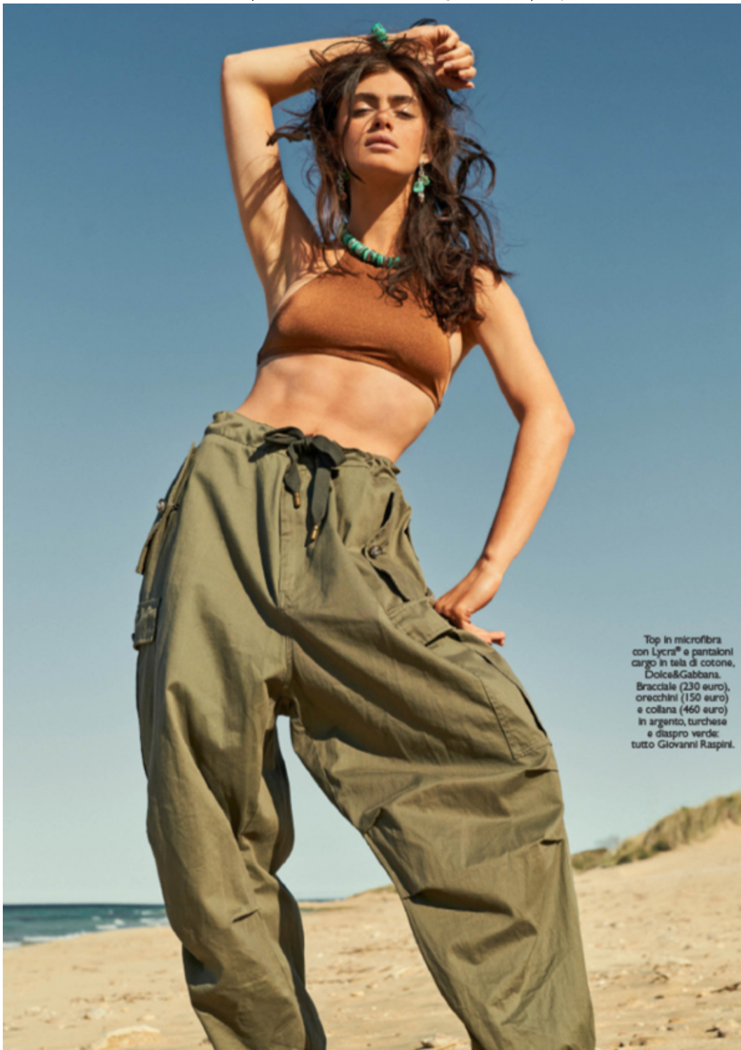
Top in microfibra con Lycra® e pantaloni cargo in tela di cotone, Dolce&Gabbana. Bracciale (230 euro), orecchini (150 euro) e collana (460 euro) in argento, turchese e diaspro verde; tutto Giovanni Raspini.