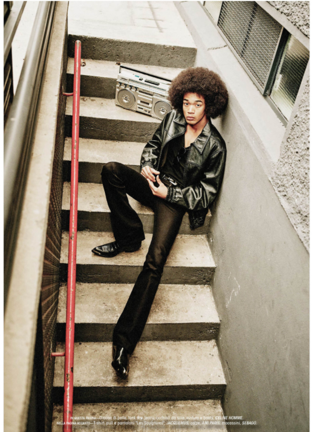
IN QUESTA PAGINA... Giacca di pelle, tank top, jeans, occhiali da sole, elmetto e boots, CELINE HOMME. NELLA PAGINA ACCANTO... T-shirt, pull e pantaloni "Les Sculptures", JACQUEMUS; calze, AMI PARIS; mocassini, SEBAGO.