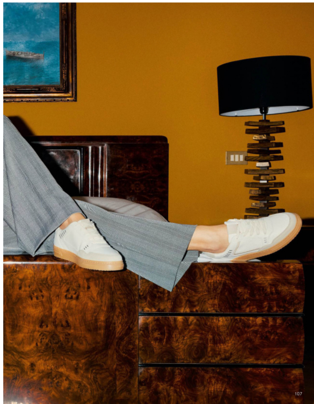
SNEAKERS HYPHALITE IN MATERIALE ECOSOSTENIBILE (TAMARIS), GIACCA DOPPIOPETTO E PANTALONI AMPI CON PIEGHE IN GABARDINE DI LANA TECNICA (TUTTO SPORTMAX), ORECCHINI (FERRAGAMO).