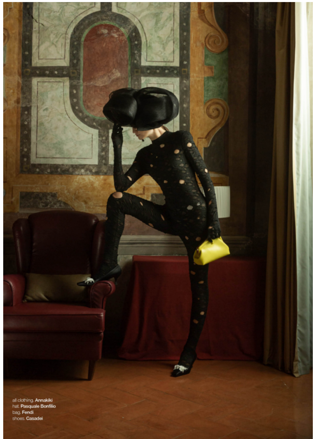
all clothing. Annakiki hat. Pasquale Bonifilio bag. Fendi shoes. Casadei