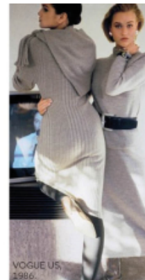
VOGUE US, 1986.

КРУЖОК ВЯЗАНИЯ Некрашенная шерсть, крупная вязка – в облегчающих фигуру платьях с V-образным вырезом ходили юные Джейн Биркин и Верушка. Узел на талии, напоминающий небрежно повязанный свиттер, – остромодный акцент.