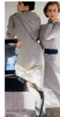
VOGUE US, 1986.

КРУЖОК ВЯЗАНИЯ Некрашенная шерсть, крупная вязка – в облегчающих фигуру платьях с V-образным вырезом ходили юные Джейн Биркин и Верушка. Узел на талии, напоминающий небрежно повязанный свиттер, – остромодный акцент.