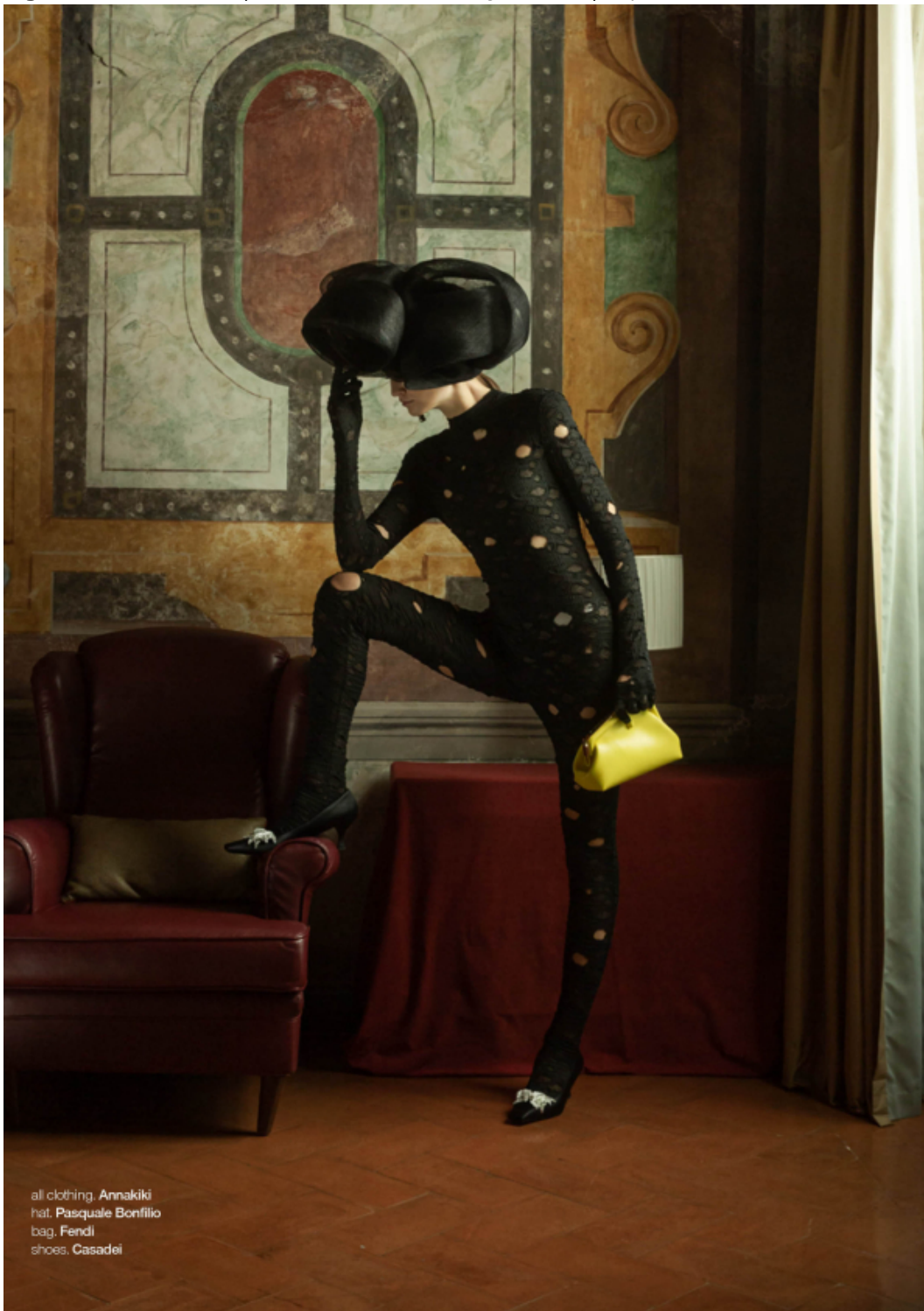
all clothing, Annakiki hat, Pasquale Bonfilio bag, Fendi shoes, Casadei