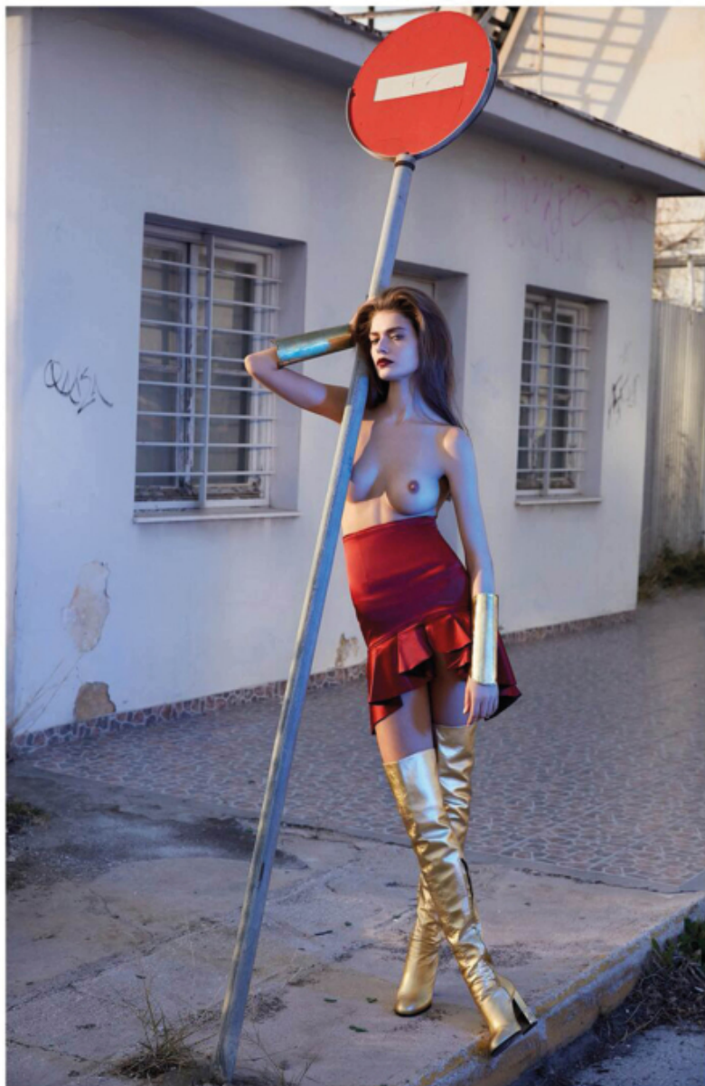
opposite page: jacket H by Haakan Yildirim, beach wear Valentino, boots Cori Amenta, this page: skirt Leit Motiv, bracelets Nicholas K, boots Cori Amenta.