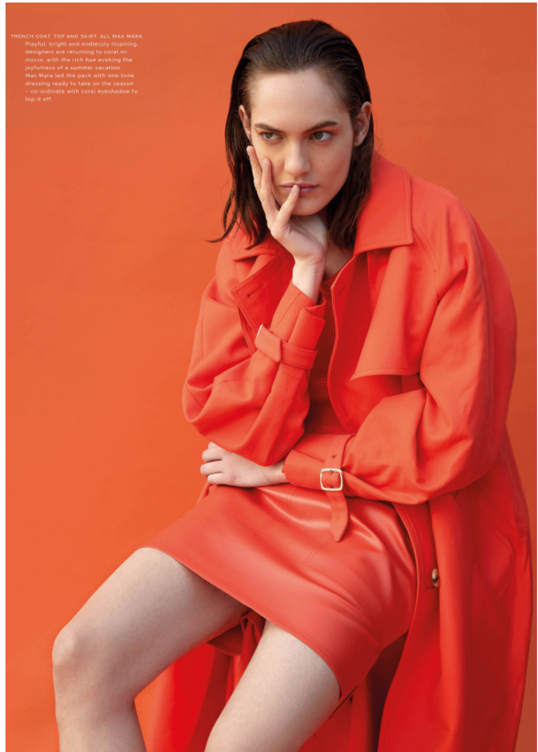
TRENCH COAT, TOP AND SKIRT, ALL MAX MARA Playful, bright and endlessly inspiring, designers are returning to coral en masse, with the rich hue evoking the joyfulness of a summer vacation. Max Mara led the pack with one-tone dressing ready to take on the season - co-ordinate with coral eyeshadow to top it off.