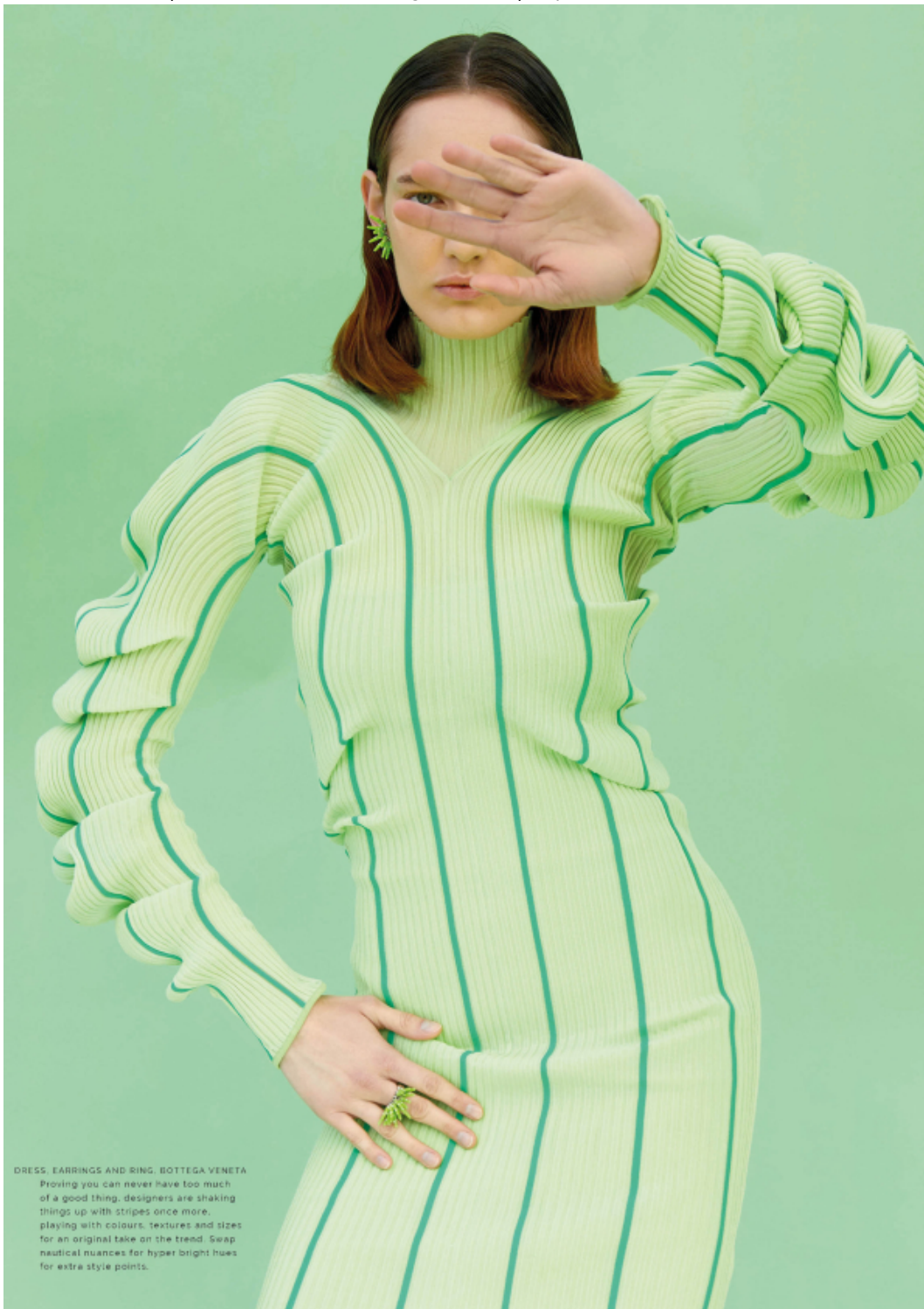
DRESS, EARRINGS AND RING, BOTTEGA VENETA Proving you can never have too much of a good thing, designers are shaking things up with stripes once more, playing with colours, textures and sizes for an original take on the trend. Swap nautical nuances for hyper bright hues for extra style points.