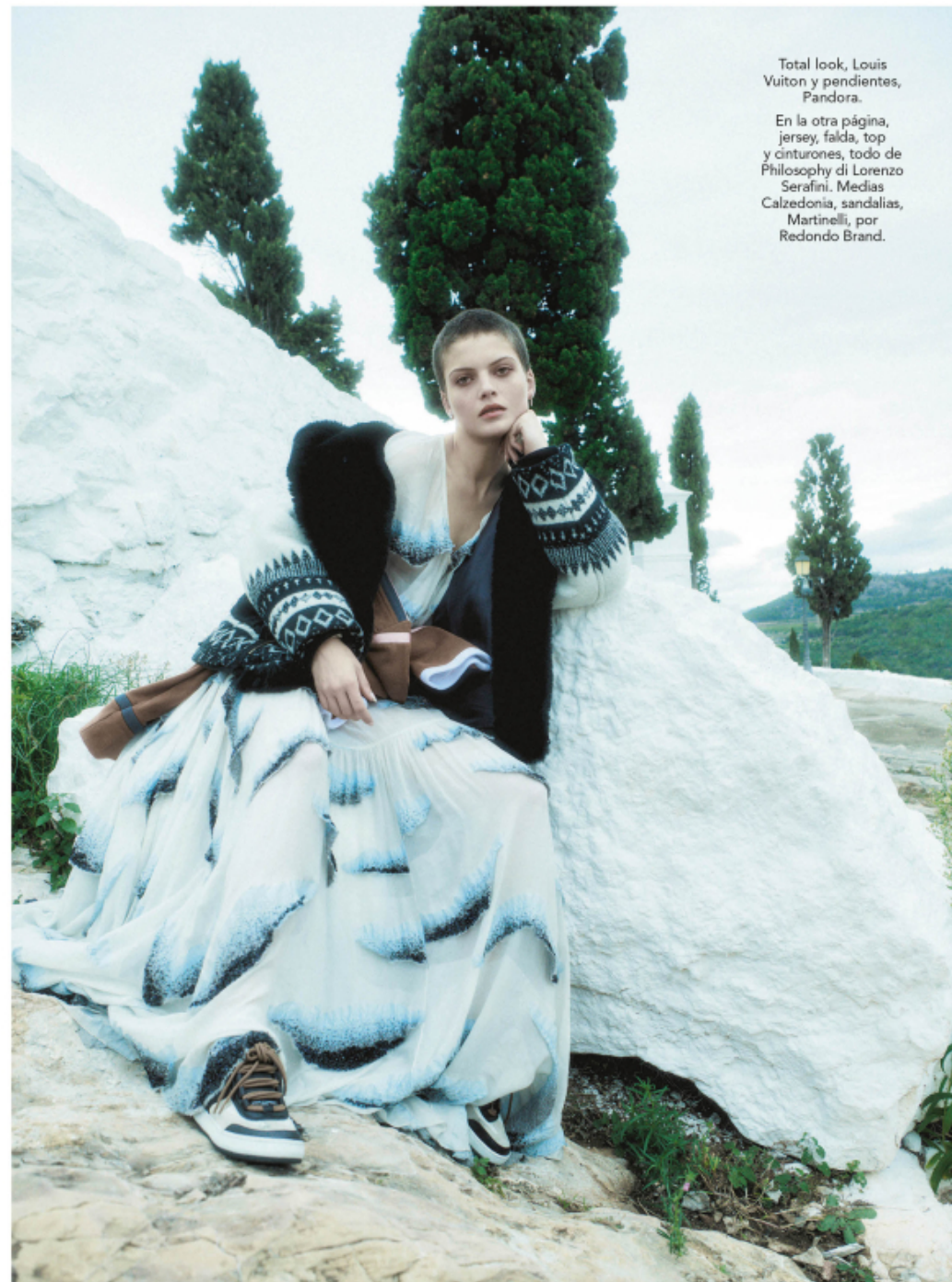
Total look, Louis Vuiton y pendientes, Pandora.