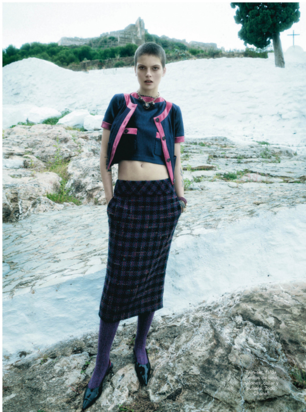
Twin-set, falda, medias de lana, salones, collar y pulsera. Todo, Chanel.