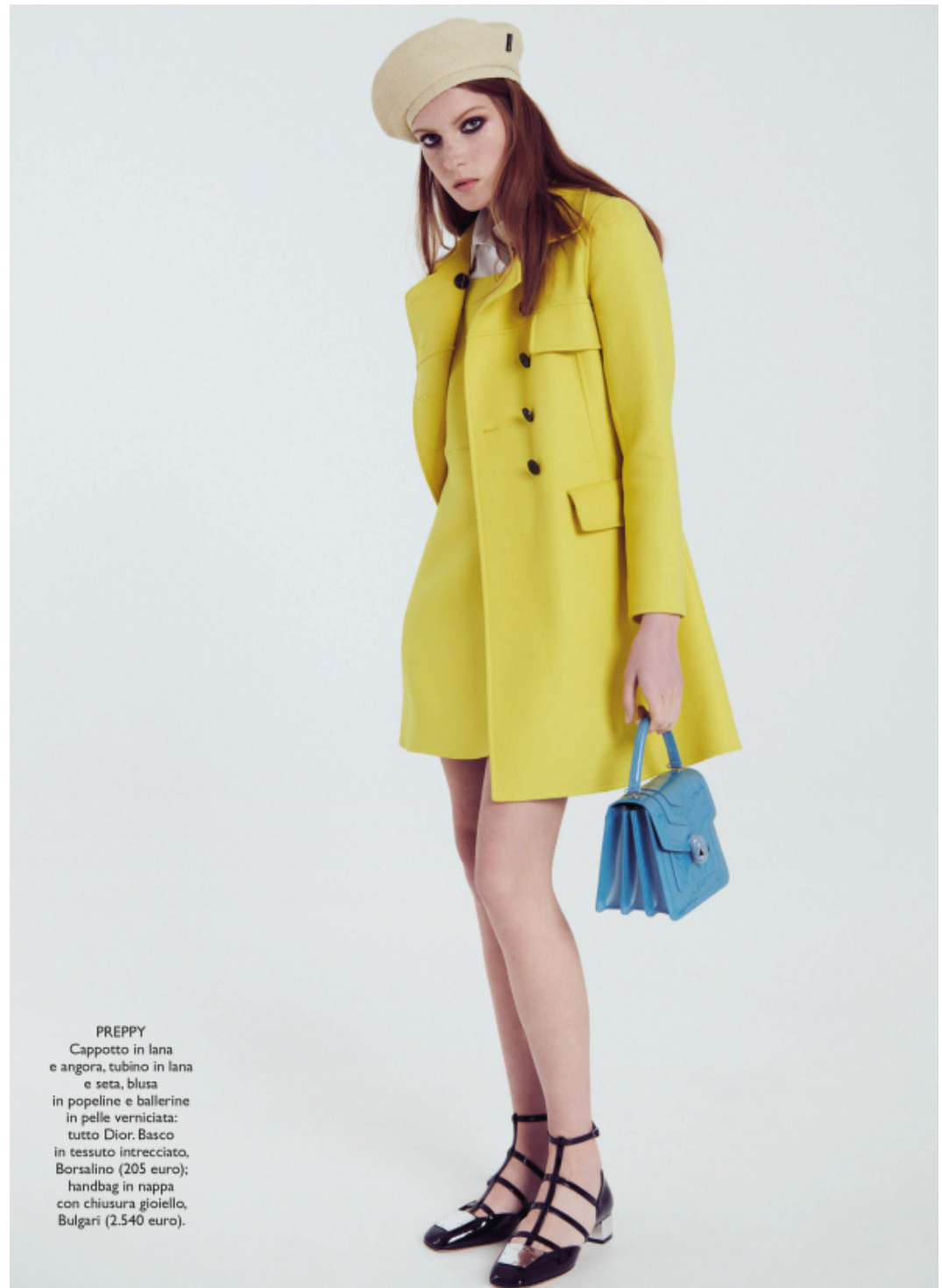
PREPPY Cappotto in lana e angora, tubino in lana e seta, blusa in popeline e ballerine in pelle verniciata: tutto Dior. Basco in tessuto intrecciato, Borsalino (205 euro); handbag in nappa con chiusura gioiello, Bulgari (2.540 euro).