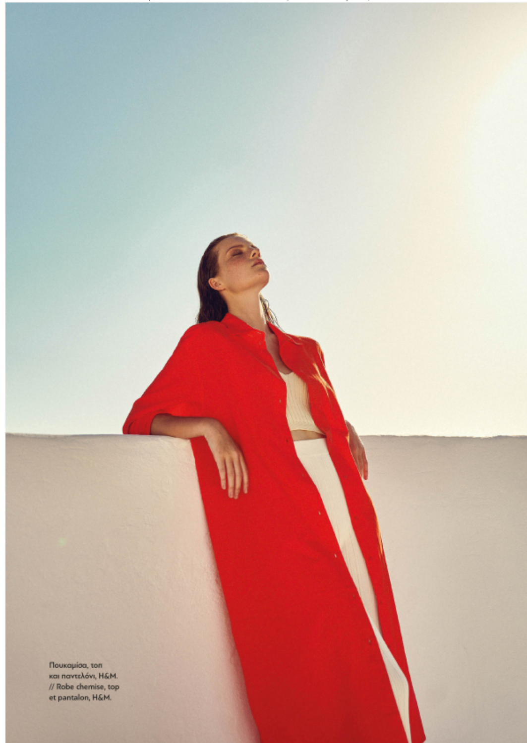
Πουκαμίσια, top και παντελόνι, H&M. // Robe chemise, top et pantalon, H&M.